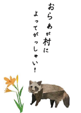
尾瀬ブランドロゴマーク