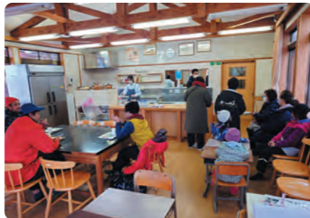
参加者で賑わうカフェスペースの様子

当日、ご参加いただいた皆様、イベント開催に向けてご協力いただいた皆様に感謝を申し上げます。今後も地域と連携した学習活動を実施していきますので、ご理解とご協力をよろしくお願いいたします。