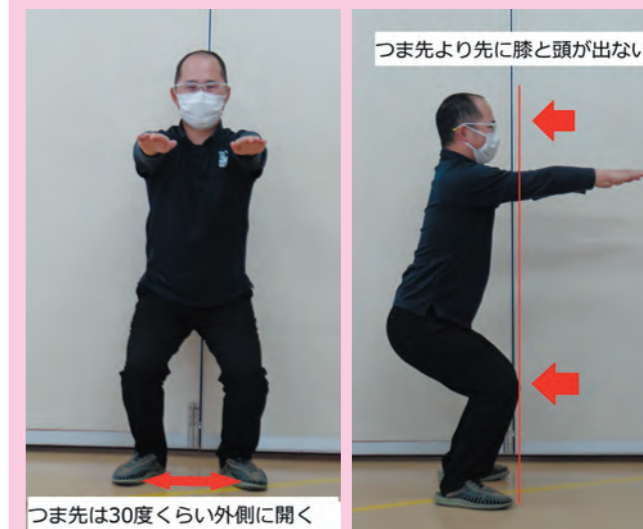
つま先は30度くらい外側に開く