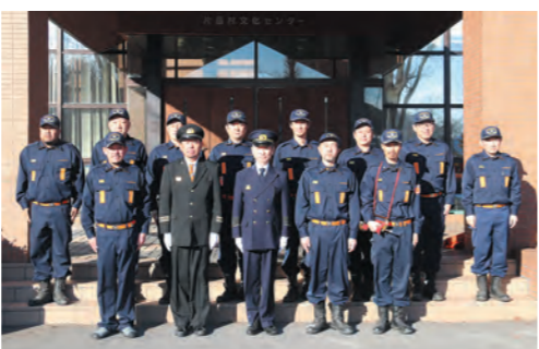
片品村消防団幹部会