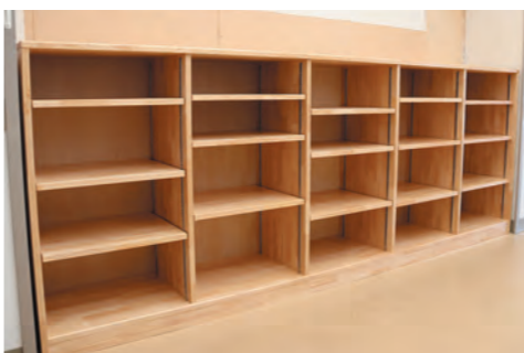
寄贈していただいた本棚

お心尽くしに感謝申し上げます、ご趣旨に沿うよう大切に使用させていただきます。 ありがとうございました。 （保健福祉課）