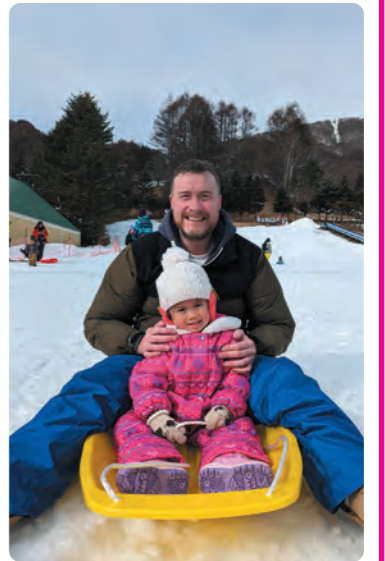
スキー場でソリ乗り！

リゾートでの時間をとても満喫したので、また近いうちに行く予定です。片品には誰もが楽しめるスキー場がたくさんあって素晴らしいです。