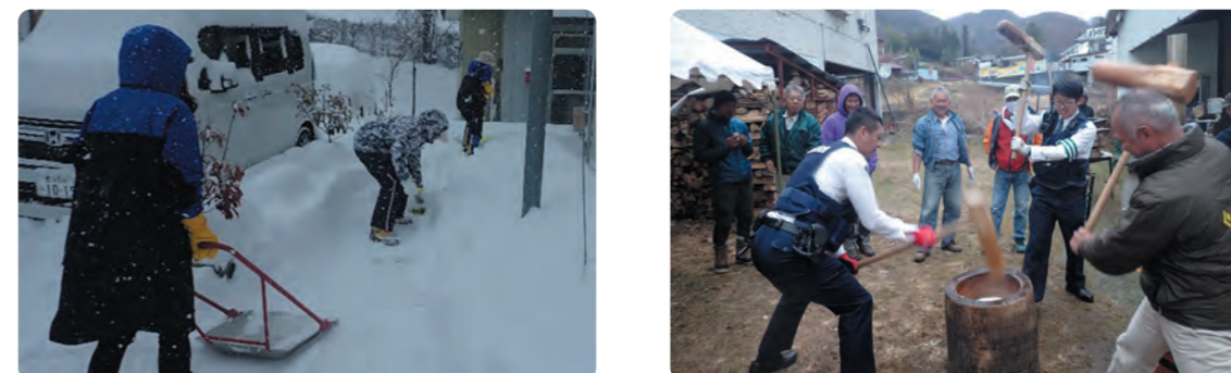
避難経路確保のための除雪作業

昨年末には有志の餅つき大会に参加させていただきました。様々な分野の様々な年代の方が集まり、代わる代わる餅をつき、つくたてのお餅を食べ、和気あいあいと談笑して過ごす時間に、コロナ禍を経てようやく穏やかな時間が戻ってきたと感じました。こちらの餅つきはそもそも35年前に家族で2日ついたことから始まり、人が人を呼び寄せ、年々来てくれる人が増えたり、変わったりしながら、今は100人近くが集まるイベントになったそうです。特注の蒸し器を提供してくれる人や、食材を持ち寄ってくれる人等、たくさんの人に支えられ、いつの間にかみんなで作り上げる会になったとお話を伺いました。こういう地域や人のつながりがいつまでも続いてほしいと感じました。