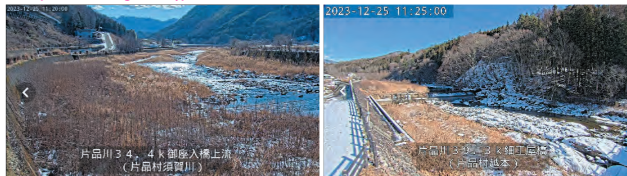
御座入橋上流河川監視カメラの様子

▼「かわみるぐんま」URL https://suibou-gunma.jp/#/