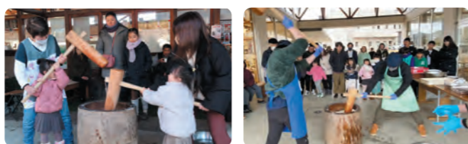
餅つき大会 花の駅

もちつき大会の日はスキー場からの帰りのお客様がたくさん参加し、もちつき体験を楽しんでいただきました。また、花の駅では同時に甘酒も振る舞われ、にぎやかで温まる時間をお過ごしいただきました。