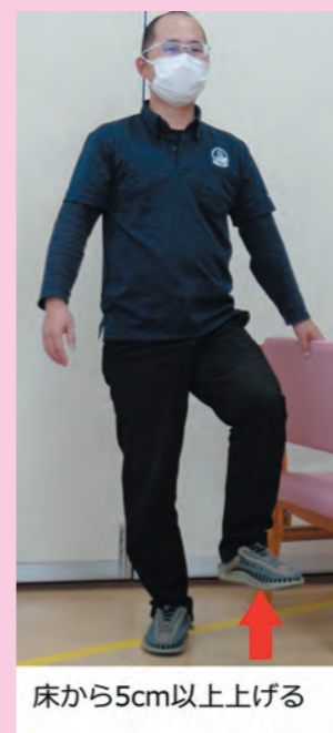
床から5cm以上上げる