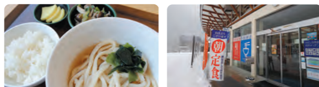
朝メニューイメージ

冬期期間、土日祝日限定で朝食を営業しています。営業時間は6:30～9:00です。朝スキー場へ行くお客様はもちろんのこと村民の皆様のご利用もお待ちしております。