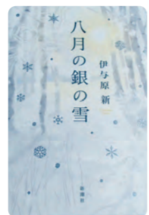
伊与原 新 著 新潮社

※午後2時00分～5時30分開室 ※休館日 土曜、日曜、祝日 ※新型コロナウイルス感染症の状況により変更になる場合があります