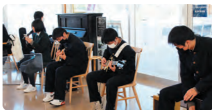
集中して演奏する生徒の皆さん

今年度もコロナ禍により演奏会がなかなか開催できない中、何としても演奏を発表したい、音楽をお届けしたい、という一心で無事に演奏会を開催することができました。