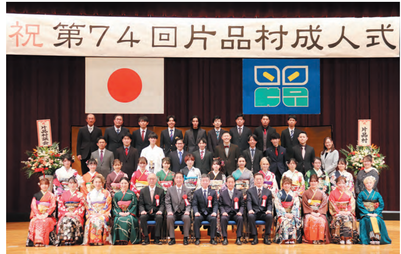
※撮影時のみマスクを外しています

1月9日(日)第74回片品村成人式が、新成人(該当者44名のうち35名が参加)とご家族、ご来賓の方々の出席により行われました。