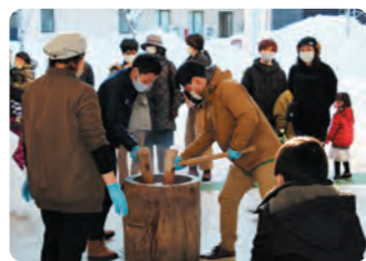
餅つき大会 道の駅

道の駅で行われたもちつき大会には、スキー場からの帰りのお客様を中心にたくさんの方が参加し、片品産のきな粉、大根、あんこをまぶして片品村の味を楽しんでいました。また、道の駅では同時に甘酒も振る舞われ、にぎやかで温まる時間をお過ごしいただきました。