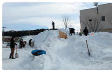
雪遊び場を作る様子

コロナ禍でまだまだ遠くへ外出することがしづらい状況ではありますが、村内のお子様をはじめ、多くの皆様に利用していただければ幸いです。