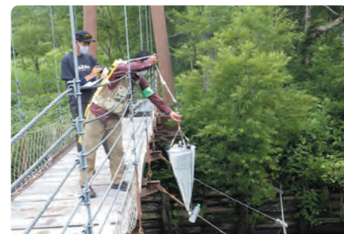
ヨッピー橋で調査を行っている様子

今後も自然環境科の授業や理科部の活動を通して、地域の自然環境について調べ、その成果について、多くの人に伝えていきたいと思っています。