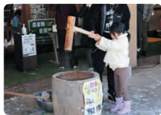
餅つき大会 道の駅