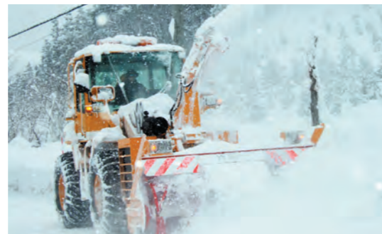
道幅ぎりぎりに除雪作業する除雪隊員

道路の事故防止、安全確保のために樹木の所有者のみなさんは伐採や枝払い等を行うことにより適切な管理をお願いします。