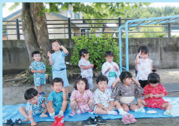
夏祭り・みんな可愛いね！(りす組)【片保】