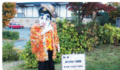
昨年度グランプリ作品

村民の皆様には、地域を盛り上げるために是非とも「かかし祭り」への参加のご協力をお願い致します。詳しくは以下の募集要項をご確認ください。