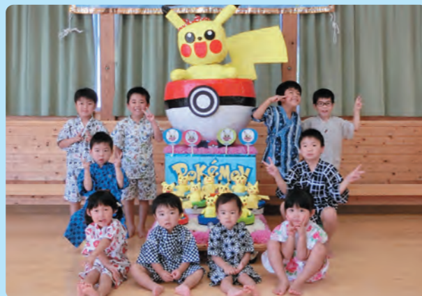
夏祭り ピカチュウゲットだぜ！【北保】