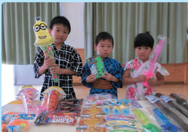
おもちゃさん いらっしゃいませ！【北保】