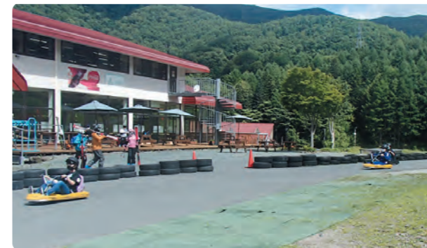
サマーリュージュ