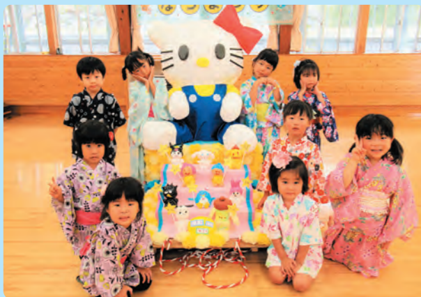
夏まつり キティちゃんおみこし【南保】