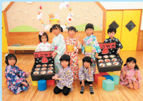
夏まつり たこ焼きゲーム楽しかったよ【南保】