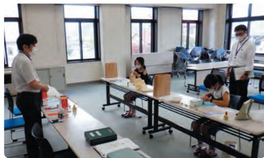
夏休みはかり工作教室の様子