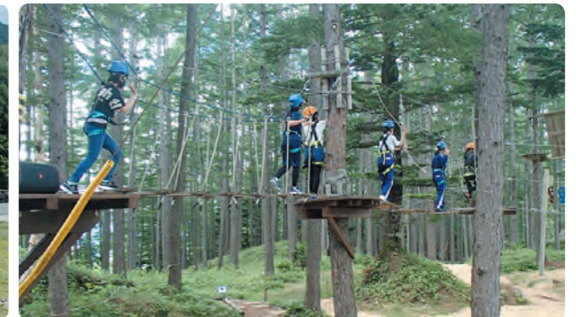
ツリーアドベンチャー