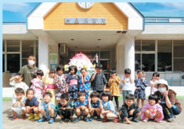
夏祭り・おみこしつったよ！(きりん組)【片保】