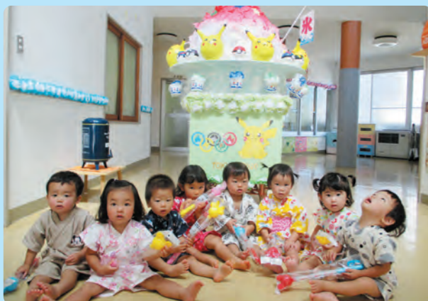
夏祭り・お買い物したよ！(ひよこ組)【片保】