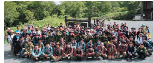
(7月に開かれた尾瀬ハートフルホーム・システム「ふれあい交流会(尾瀬探勝会)」にて)