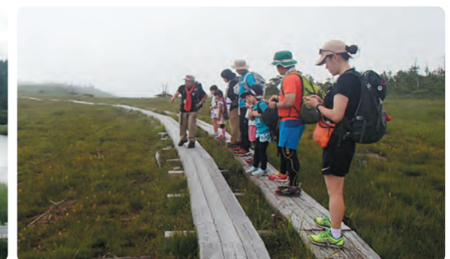
アヤメ平での観察の様子