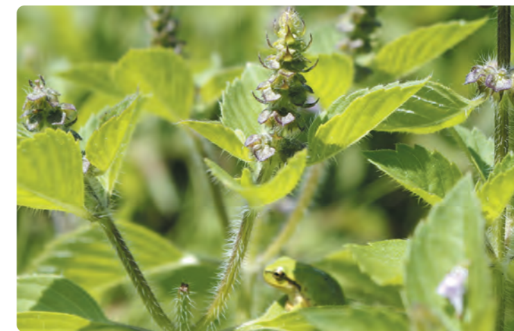
片品のホーリーバジル

自分たちの実体験を通じて、片品村の新鮮でおいしい食べ物を村外の方にも知ってもらいたい！とより強く思い、ふるさと納税の返礼品を増やしたり、ふるさと納税サイトの写真や文章に手を加えたりと試行錯誤をしています。寄附をきっかけに、片品村を知っていただき、興味を持ってもらい、コロナが落ち着いたときに足を運んでいただくきっかけになればと思い日々業務しております。