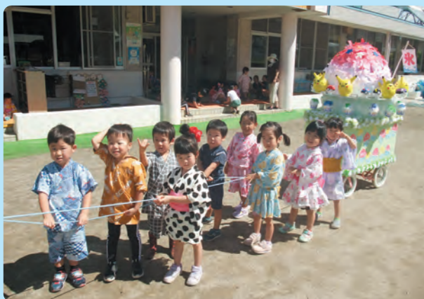
夏祭り・おみこしワッショイ！(うさぎ組)【片保】