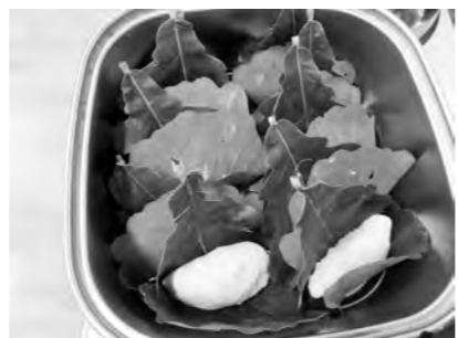
大きな柏の葉で包んだ生地