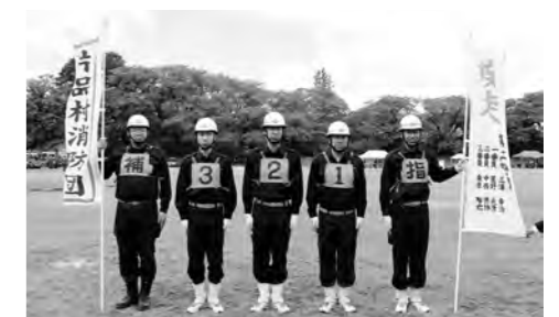
小型ポンプの部4位入賞の第2分団