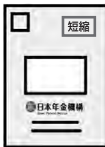
右上に赤字で短縮と書かれたこのような黄色の封筒(A4サイズ)です!