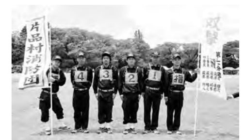
ポンプ車の部5位入賞の第7分団