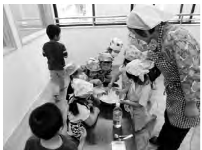
ゆう先生、これでいいの? 次、私の番だよ、代わって〜!

昔、片品村では6月の田植えがすんだ後の「こもの休み」に柏もちを食べ、労をねぎらっていたそうです。昔食べていた食べ物を子ども達にも作ったり食べたり体験し、お話を聞き、郷土食について興味をもってほしいと思います。(保健福祉課)