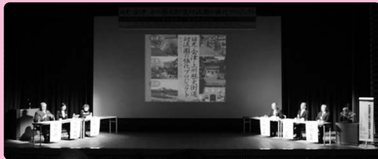
シンポジウム会場の様子

パネルディスカッションで国道120号線(金精峠)の年間開通のためにこのプロジェクトに期待していると語る千明村長