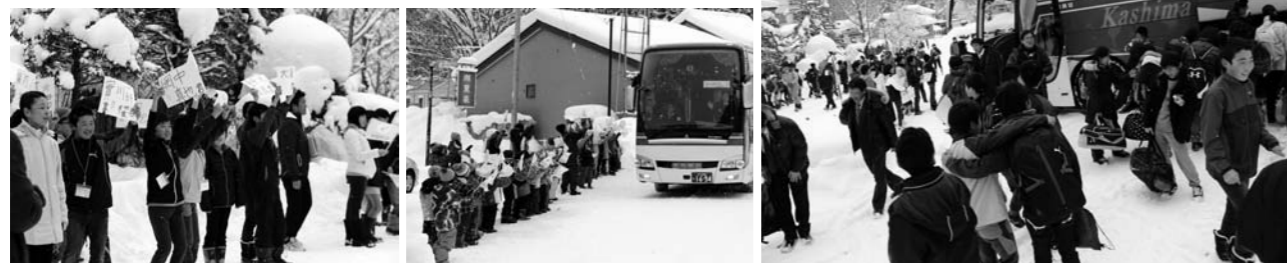
片品小学校全校児童による出迎えと、久しぶりに友達と再会し和気藹々とする様子

今年で51回目となり、統合した片品小学校として初めて、明神小学校の児童を迎えました。