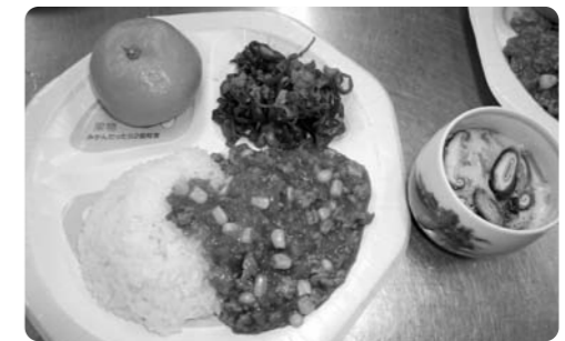
上手にできました