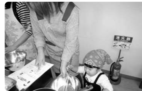
一生懸命にお手洗い

朝食について、野菜1日350g摂取、減塩等正しい食生活についての講話と時短簡単メニューの調理実習を行いました。「この教室に参加して、栄養のバランスを考え、大切な家族のために食事を作りたい」と感想に書いてくださった方もいました。