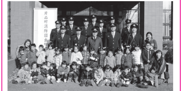
片品村消防本団と園児のみなさん

まだ寒い日が続きますがストーブ等、火の取り扱いには十分注意してください。(総務課)