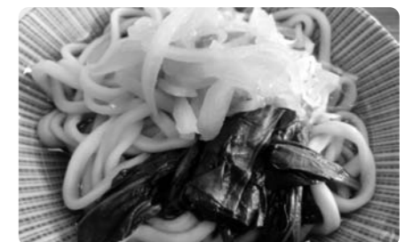
おいしいうどんの出来上がり

うどんのつゆも玉ねぎ、人参、青ねぎをたくさん入れ、だしを取ったもので、野菜の甘みが出ておいしいつゆが出来上がり、手打ちうどんにマッチしていました。参加したお年寄りもおいしそうに食べており、おかわりした方もいました。