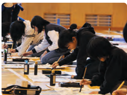
上手に字が書けたかな!?

1月11日（金）に片品小学校体育館で、書き初め大会が行われました。当日は講師を招き、3年生は「お正月」、4年生は「美しい空」、5年生は「新春の光」、6年生は「伝統を守る」を書きました。ミスをして修正が効かない緊張感の中、一生懸命に不慣れた筆を動かしていました。書き初めは、新しい年に文字を書き神様に納めることで、文字がきれいに書けるようになります。を願っています。みなさんの文字がきれいになり、よりいっそう勉学に励まれることを願っています。