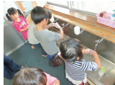
歌に合わせて手洗いしましょう