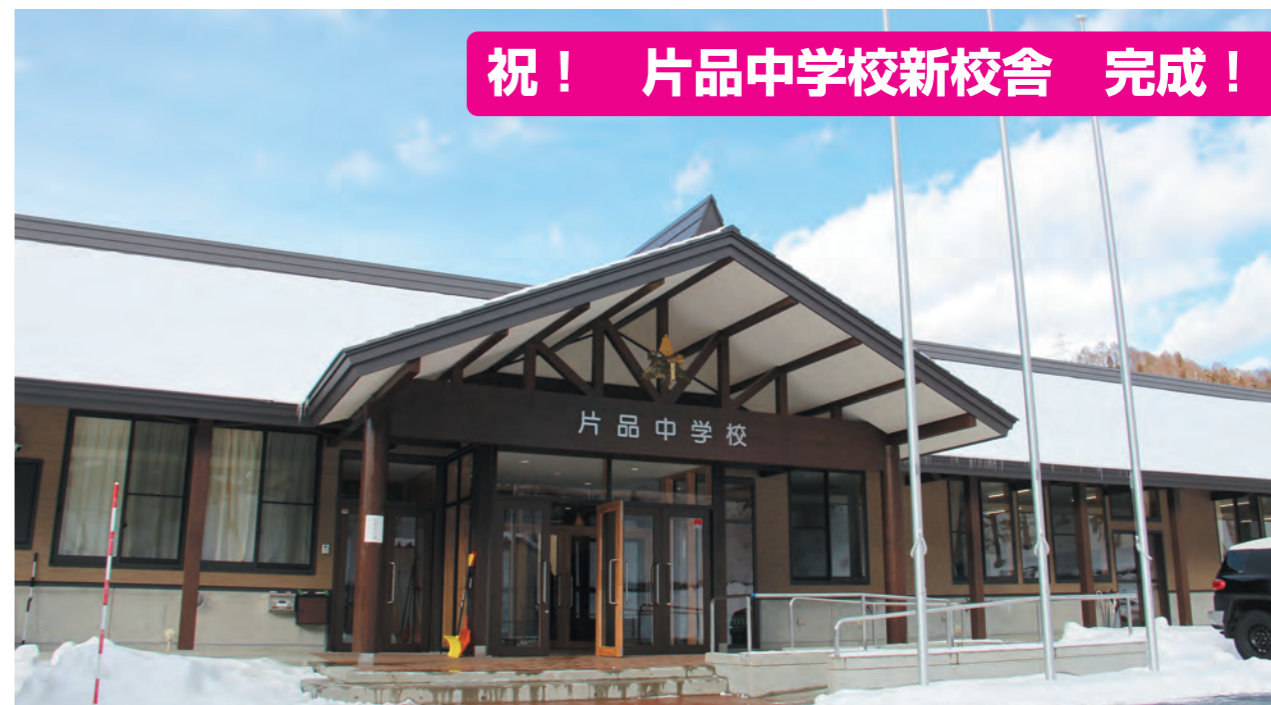
片品中学校新校舎 正面玄関