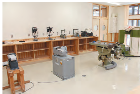
大型の機械もある技術室