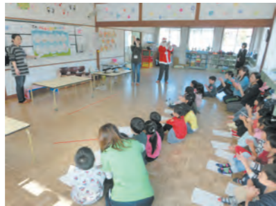
支部長サンタから手洗い指導