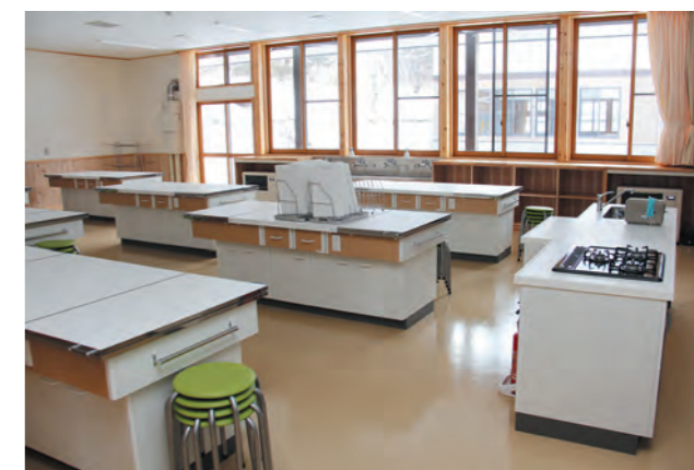
安全に調理ができる調理室