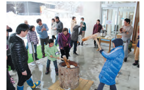
一生懸命ついておいしいお餅ができました(道の駅)

道の駅で行われたもちつき大会には、スキー場からの帰りのお客様を中心に約50名が参加し、片品産のきな粉、大根、えごま、あんこをまぶして片品村の味を楽しんでいました。また、片品産のもち米で作った甘酒も振る舞われ、美味しいととても評判でした。