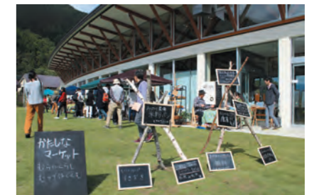
昨年試験的に開催し大盛況(道の駅)

道の駅では、5月から11月までの毎月第1日曜日に「かたしなマーケット」を開催いたします。3月6日（水）午後1時30分から役場2階研修室にて出展者説明会を開催しますので、出店希望の方は3月4日（月）までに道の駅へ電話連絡のうえ、説明会に必ずご参加ください。