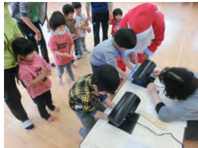
ブラックライトで手洗いチェック