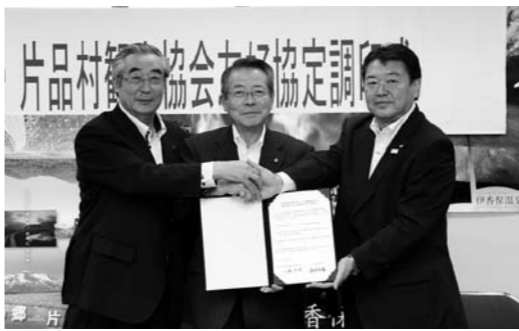
(左)阿久津市長 (中)千明村長 (右)大森会長

千明村長は、インバウンドなくしては今後の観光は成り立たない。この友好協定を期に両観光協会が手を取り合っ て協力し、少しでも多くの外国の方が伊香保・片品村にお越しただけだと思えます。他にも、日光東照宮・富岡製糸工場と2つの世界遺産を結ぶルートに、伊香保と片品があることから、海外からのお客様がより多くお越しただけ だけでなく、観光ルートを開拓して行きたいと語った。