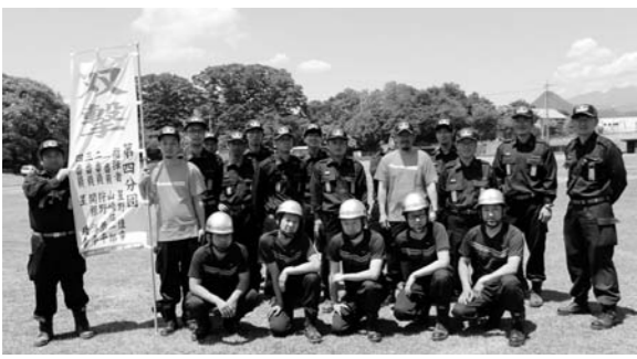
ポンプ車の部出場 第4分団のみなさん

今年度は、ポンプ車の部に第4分団が出場、4月中旬から東消防署の指導を受けながら毎晩練習を重ね大会に臨みましたが、結果は僅差で入賞を逃してしまいました。