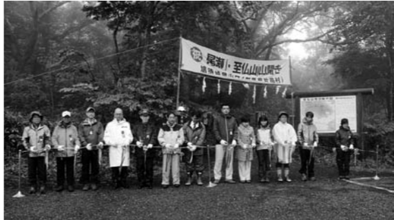
代表者によるテープカット

日本百名山に数えられている武尊山(6月16日)、日光白根山(6月20日)、至仏山(7月1日)の山開きがそれぞれの登山口で行われ、地元の観光産業の発展と登山者及び関係者の安全を祈願しました。今年もいよいよ本格的な夏山シーズンを迎えますが、登山の際は事前にしっかりとした計画を立て、安全で楽しい登山をされますようお願いいたします。(むらづくり観光課)