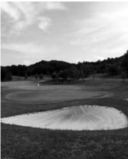
サエラ尾瀬ゴルフ&リゾート