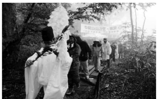
関係者全員でのぼり初め

日本百名山に数えられている武尊山(6月16日)、日光白根山(6月20日)、至仏山(7月1日)の山開きがそれぞれの登山口で行われ、地元の観光産業の発展と登山者及び関係者の安全を祈願しました。今年もいよいよ本格的な夏山シーズンを迎えますが、登山の際は事前にしっかりとした計画を立て、安全で楽しい登山をされますようお願いいたします。(むらづくり観光課)