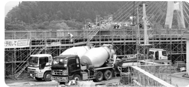
片品小学校建設現場の様子

引越しの期日は未定ですが、具体的な日程が決まりましたら、関係の皆様と相談しながら計画を立てていきたいと思っています。 スクールバスによる登下校も村では検討していただいています。詳細がわかりましたら保護者の皆様等にはお知らせします。 現在、来年度の統合がスムーズにいくように片品の三小学校では交流学習を計画し、一部はすでに実施済みです。教育の内容に関しては、小中学校が各一校になると、今まで