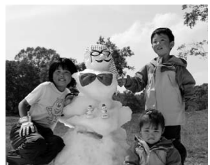
大きな雪だるまができました

6月13日(土)レンゲツツジまつりが武尊牧場三合平で行われました。会場では『尾瀬太鼓愛好会』『フォークソンググループKMC』『尾瀬高校吹奏楽部』の演奏などが披露されました。他にも、恒例になった残雪のゲレンデでソリのりやパン食い競争・雪だるまコンテストなどが行われ来場いただいた