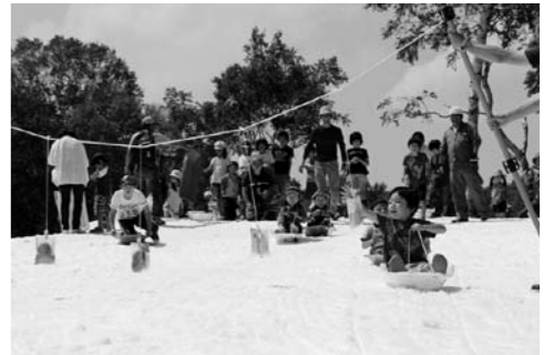
パン食い競争で楽しむ子供たち

6月13日(土)レンゲツツジまつりが武尊牧場三合平で行われました。会場では『尾瀬太鼓愛好会』『フォークソンググループKMC』『尾瀬高校吹奏楽部』の演奏などが披露されました。他にも、恒例になった残雪のゲレンデでソリのりやパン食い競争・雪だるまコンテストなどが行われ来場いただいた