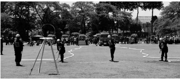
ポンプ操法競技の様子