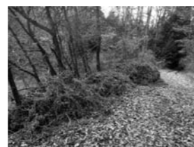
林道わきに捨てられた廃棄物

今後こういった事案がなくなるよう、村民の皆様のご協力をよろしくお願いいたします。