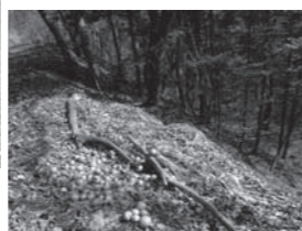
投棄された農作物とビニール