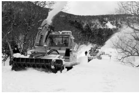
金精峠菅沼周辺の除雪の様子