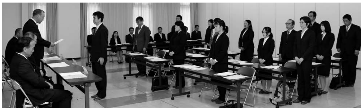
転出された皆さん大変お世話になりました。転入された皆さんよろしくお願いいたします。