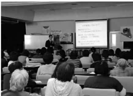
肺がんについての講演会の様子