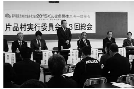
2015 ぐんま冬国体解散総会の様子

3月30日(月)役場2階農林研修室において、第70回国民体育大会冬季大会スキー競技会片品村実行委員会第3回総会が開催されました。