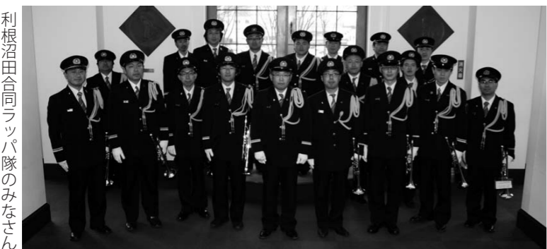
利根沼田合同ラッパ隊のみなさん