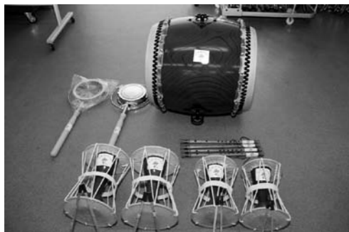
八木節用太鼓など

このたび、片品村では、平成26年度コミュニティ助成事業を受け、第8区がテント・テーブル・ベンチ・ミニバレーボール用ネット・老人会輪投げセット・八木節用太鼓・カネ・笛・マイク・スピーカー・マイクテーブルを購入しました。この事業は(財)自治総合センターの行っている事業でコミュニティ活動を促進し、そ