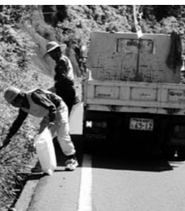
村内全域で清掃活動する協会のみなさん

5月30日(水)「ごみゼロの日」片品村建設業協会が道路クリーン作戦を実施しました。