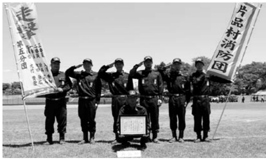
小型ポンプの部 第6位 第5分団選手

出場分団の選手・役員の皆さん長期にわたり大変お疲れ様でした。また、激励にお越しいただ