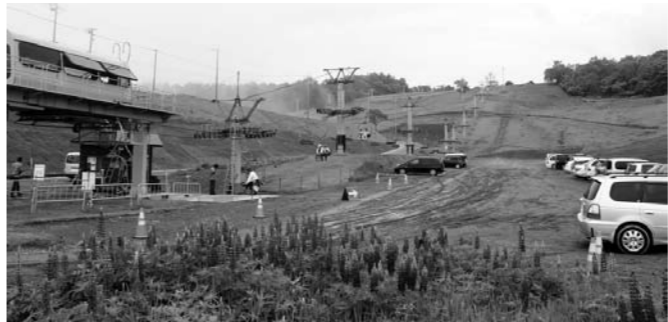
第6リフトと周辺の様子

夏山リフトも以前の2本乗継から、第6リフト1本と利用される方にも、歩かれる方にも大変便利になりました。場内の道路は、管理用道路とすることもあり、狭く、交互通行になる箇所もありますので、ご利用の際には、徐行し、安全運転でご利用いただきますようお願いいたします。(むらづくり観光課)