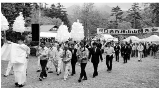
関係者全員でのぼり初め

日本百名山に数えられている武尊山(6月18日)、日光白根山(6月20日)、至仏山(7月1日)の山開きがそれぞれの登山口で行われ、地元の観光産業の発展と登山者及び関係者の安全を祈願しました。今年もいよいよ本格的な夏山シーズンを迎えますが、登山の際は事前にしっかりと計画を立て、安全で楽しい登山をされますようお願ひします。(むらづくり観光課)