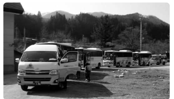
児童を送迎するスクールバス