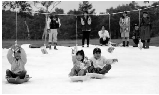
パン食い競争で楽しむ来場者

6月22日(日)武尊1500m フェスティバルが武尊牧場三合平で行われました。当日は、あいにくの空模様でしたが、会場では『尾瀬太鼓愛好会』『フォークソンググループ』『尾瀬高校吹奏楽部』の演奏や地元の方による模擬店、恒例になった残雪のゲレンデでソリのりやパン食い競争などが行われ来場いただきましたお客様に喜んでいただきました。