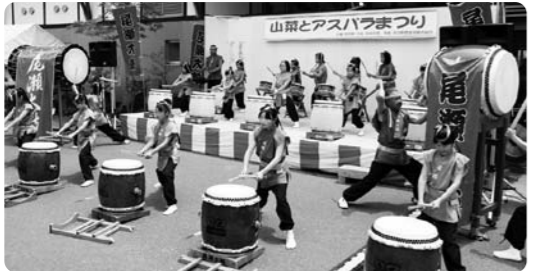
イベント行事で大活躍の尾瀬太鼓愛好会

全身を使っの演奏は、体力づくりに最適です。また、礼儀、節度、作法を大切に、和気あいあいと練習しています。この機会に和太鼓をはじめませんか。皆さんの入会をお待ちしています。 ▼入会資格 村内の小学校1年生から大人まで ▼練習日 毎週月・木曜日（7月は月・金曜日）午後7時～8時30分まで ▼練習場所 文化センター ▼入会申込 7月末日までに、尾瀬太鼓愛好会事務局へ申し込みください。 ▼問い合わせ先 むらづくり観光課 ☎(58) 2112