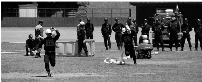
練習の成果を発揮したポンプ操法の様子