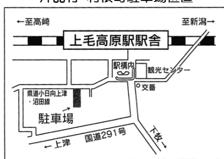
片品村・利根町駐車場位置 (総務課)

《また、最近は無断駐車が多発しており、駐車券を受け取った方が駐車できないといった苦情が寄せられており、定期的に監視等実施し、警告をさせて頂いています。ルールを守って正しく利用されるよう、ご理解、ご協力をお願いします。》