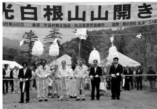
代表者によるテープカット

日本百名山に数えられている武尊山(6月18日)、日光白根山(6月20日)、至仏山(7月1日)の山開きがそれぞれの登山口で行われ、地元の観光産業の発展と登山者及び関係者の安全を祈願しました。今年もいよいよ本格的な夏山シーズンを迎えますが、登山の際は事前にしっかりと計画を立て、安全で楽しい登山をされますようお願ひします。(むらづくり観光課)