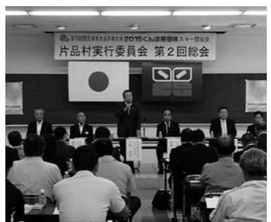
ぐんま冬国体第2回総会の様子

国体の開催まであと220日余りとなりましたが、大会が成功裡に終了するよう村民皆様のご協力をお願いいたします。