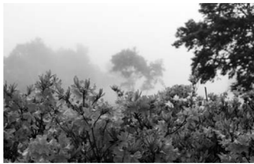
霧の中でレンゲツツジ満開!!

武尊牧場の三合平は、満開のレンゲツツジ撮影される力メラマンが多く、霧の中のレンゲツツジなど、その時の天候条件でしか撮影できない写真を楽しんでいただきました。ご来場いただいた皆さん、関係者の皆さん、大変お疲れ様でした。武尊牧場夏山リフト運行武尊牧場では、本年度から二合平(第6リフト乗り場)まで一般車両の通行をはじめました。