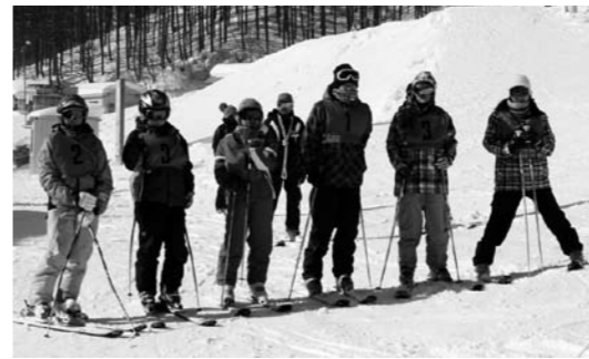
楽しかったスキー交流

アトラクションでは、尾瀬太鼓愛好会の方々に力強い演奏を披露していただき、会場を盛り上げていただきました。その後、各校に移動して歓迎行事が行われました。そして、それぞれの家庭に向かい、友情を深めることができました。