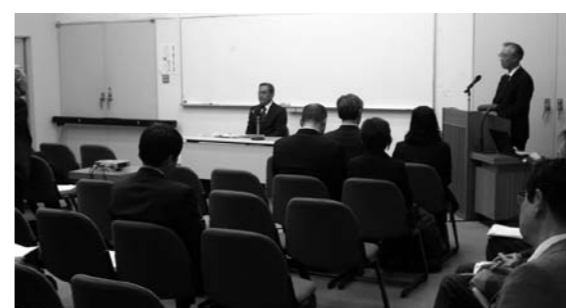
「特色ある教育活動」交流会の様子