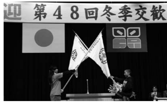
受入式 JRC 旗入場

文化センターでは、片品連合小学校の児童41名をはじめ、片品小学校の1年生から5年生までの子どもたち、保護者、村民の方々が小旗や手を振って明神小学校の方々に