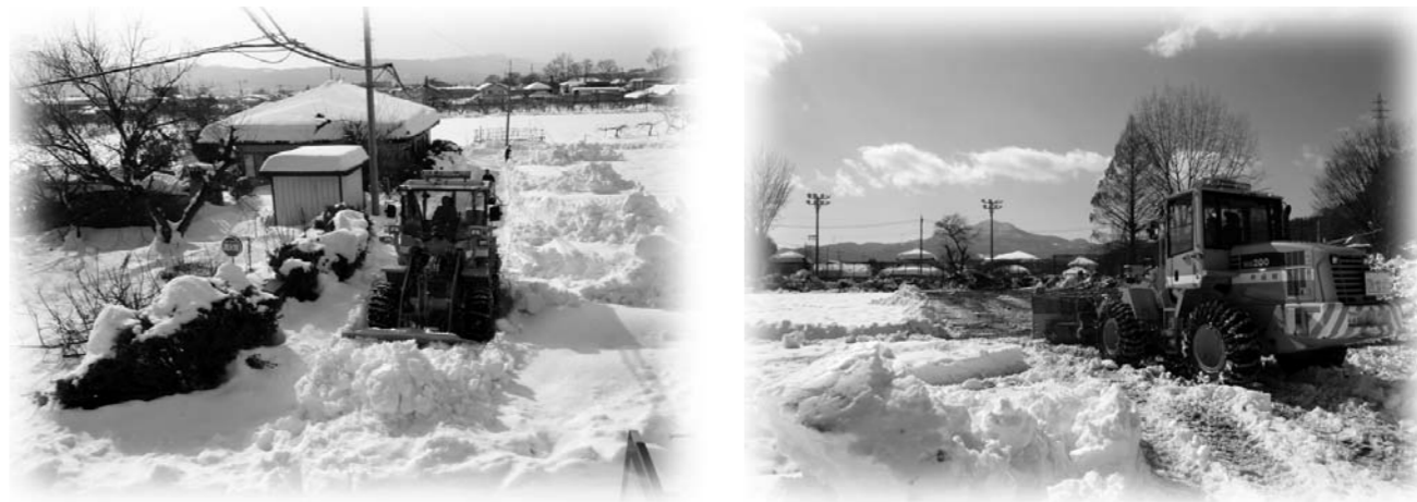
▼3月号のおしどり夫婦は都合によりお休みさせていただきます。