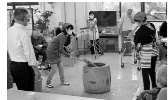
交流会で餅つきの様子

そして、最後にお年寄りと一緒に歌おうという企画を立て、「七夕さま」を、子どもたちは、トライアングルや鈴を持ち入所者の方全員と合唱しました。以上のような盛りだくさんの内容でした。子どもたちも長年続けてきているので、お年寄りと一緒に接することが出来てとても感心しています。第2回目の桜花苑交流会は、12月13日に、4・5・6年生が、餅つきをして、ついたお餅を入所者の方と全校児童で、会食しました。