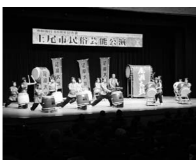
演奏する尾瀬太鼓愛好会の様子

この公演は、民俗芸能に対する市民の理解と関心を高め、その保存継承活動の活性化を図るために5年に1度行われています。他にも、尾瀬太鼓愛好会は、県内外で行われる演奏会など