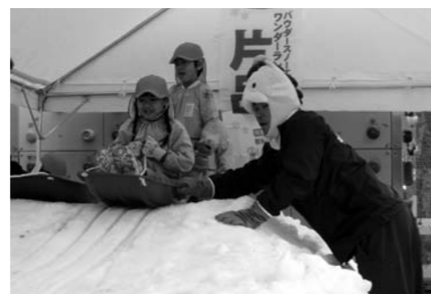
ソリのりを楽しむ園児の様子

2月27日（木）首都圏の子ども達に、雪遊びの楽しさを体験してもらおうイベントを、スキー場連絡協議会と観光協会の共催で行いました。