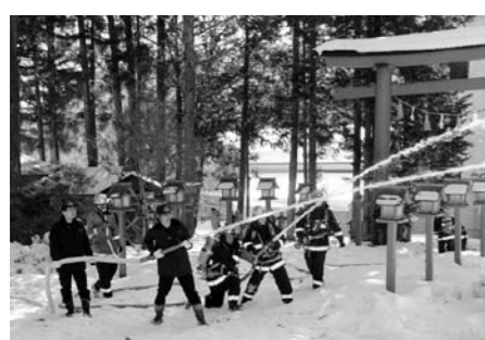
合同で行われた消火活動の様子

1月24日(金)花咲にある村の指定重要文化財の武尊神社において、東消防署・第3分団及び武尊神社関係者合同で文化財火災を想定した「消防訓練」を文化財防火デーに合わせて実施されました。 訓練は近くの住民が神社境内から出火を発生、119番通報、周囲にいた住民が重要物品搬出・消火器で初期消火を行い、第3分団員が消火栓からの放水・東消防署の放水と消火訓練が行われました。 今回参加していただいた武尊神社氏子の皆さんや第3分団員、又見学された南保育所園児の皆さん寒い中大変お疲れ様でした。 (総務課)