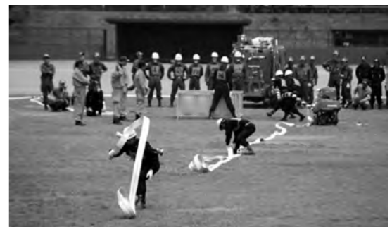
第1分団小型ポンプ操法の様子

6月2日(日)沼田公園グラウンドにおいて、消防団員の機械器具の取扱いと操作技術の向上を目的に開催されました。今年度は、小型ポンプの部に第1分団が出場、4月中旬から東消防署の指導を受けながら毎晩練習を重ねる大会に臨みました。結果は上位と僅差で第5位入賞となりました。出場分団の選手・役員の皆様