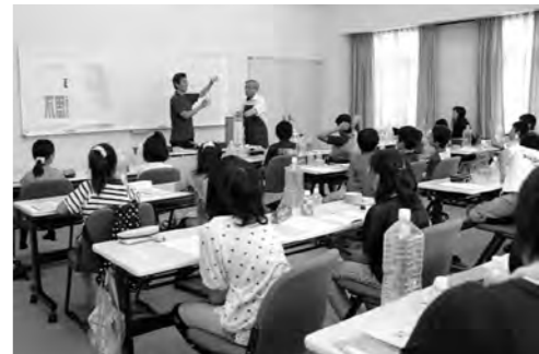
説明を真剣に聞く子供たち