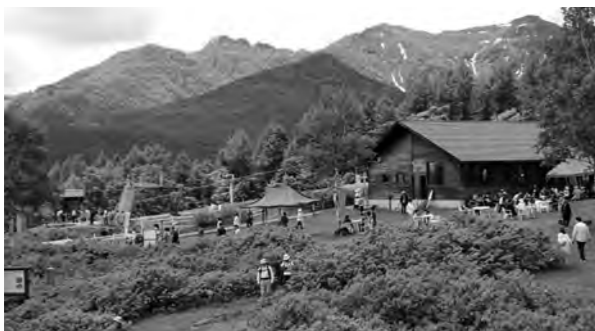
満開のレンゲツツジで賑わう三合平

他にも、会場では地元の方による模擬店や、恒例になった残雪のゲレンデでソリのりやパン食い競争・宝探しなどが行われました。