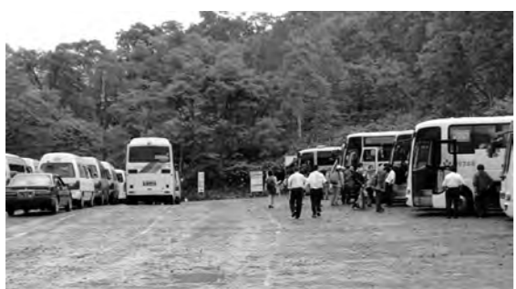
第2駐車場で乗降する登山者