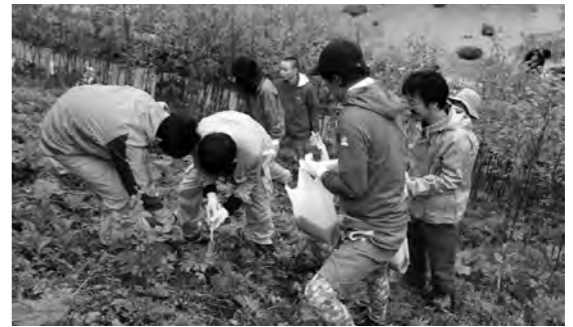
シラネアオイの苗を移植する様子