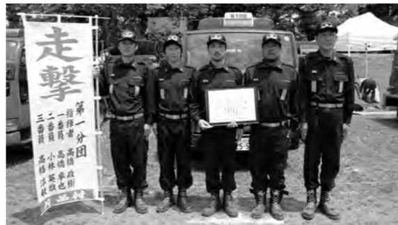
選手(第1分団)のみなさん

6月2日(日)沼田公園グラウンドにおいて、消防団員の機械器具の取扱いと操作技術の向上を目的に開催されました。今年度は、小型ポンプの部に第1分団が出場、4月中旬から東消防署の指導を受けながら毎晩練習を重ねる大会に臨みました。結果は上位と僅差で第5位入賞となりました。出場分団の選手・役員の皆様