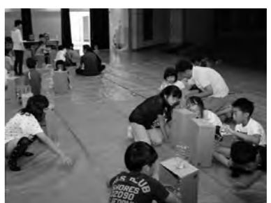
自分で作った装置でふん水になるか実験