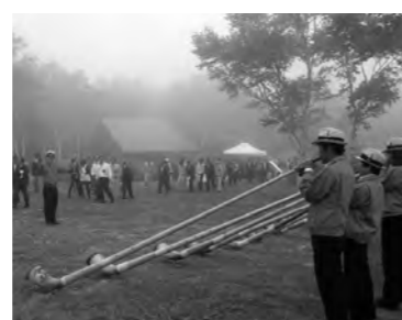
アルプホルンの演奏をバックに登り初め

今年もいよいよ本格的な夏山シーズンを迎えますが、登山の際は事前にしっかりと計画を立て、安全で楽しい