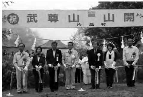
代表者によるテープカット

日本百名山に数えられている武尊山(6月12日)、日光白根山(6月20日)、至仏山(7月1日)の山開きがそれぞれの登山口で行われ、地元の観光産業の発展と登山者及び関係者の安全を祈願しました。