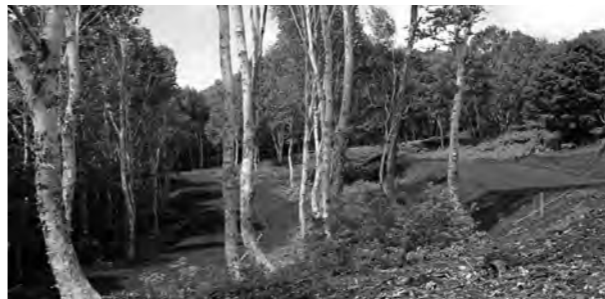
建設中のクロスカントリーコースの様子