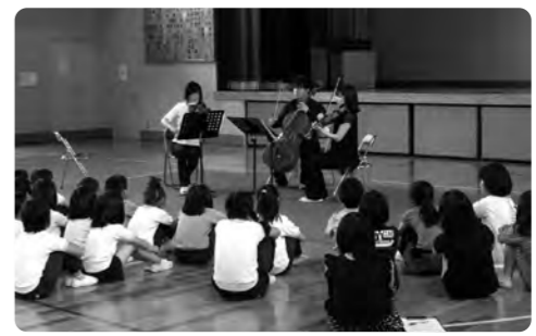
弦楽器三重奏に聞き入る児童

▼問い合わせ先 片品村教育委員会全中・国体スキー競技会準備室 ㊞(25)5600 FAX(25)5601