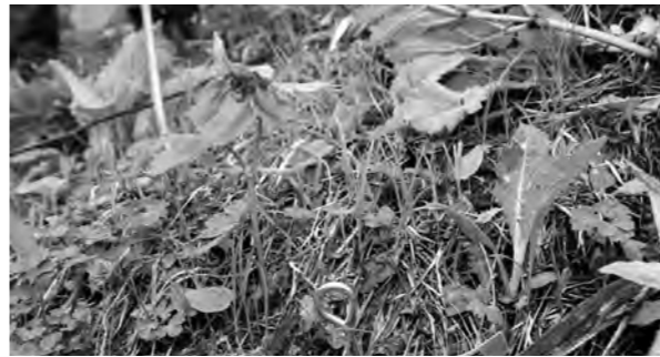
少しずつ復元しているシラネアオイ