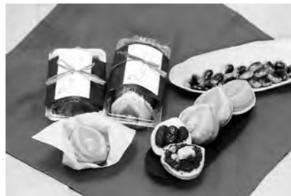
“新商品”水芭蕉焼き