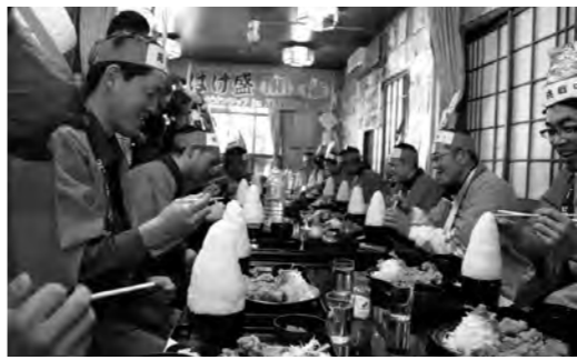
もりもり食べる挑戦者