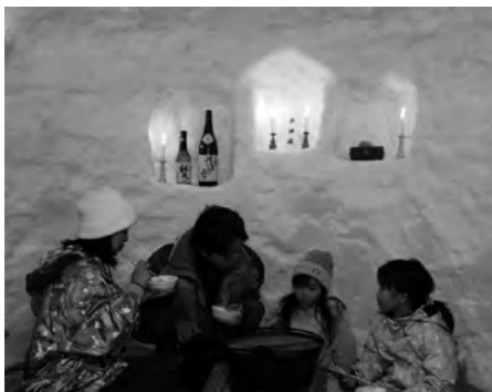
かまくら体験をするお客様の様子

準備に携わった地元の有志の皆さん、そして、サエラスキーリゾート関係者、尾瀬高校生の皆さん大変お疲れ様でした。(むらづくり観光課)