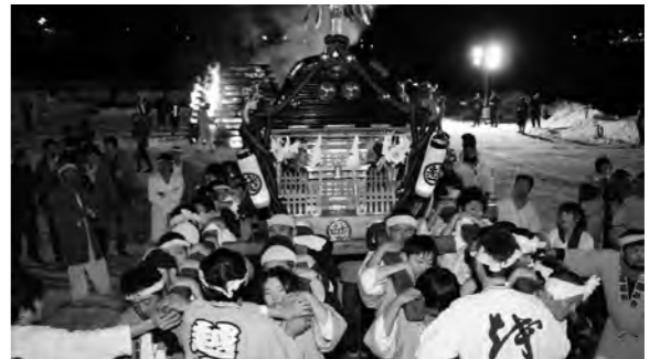
熱気あふれる神輿渡御

お祭りの中頃には豆まきが行われ、会場に集まった方にお菓子やみかんなどが振る舞われました。