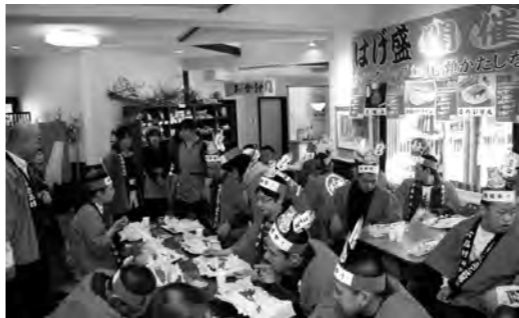
全員クリアし「かたしなや」ではげ盛ドック