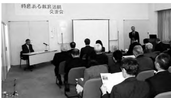
「特色ある教育活動」交流会の様子