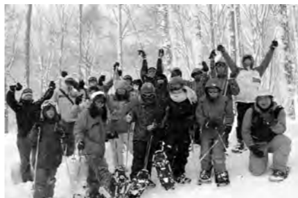
参加者に大絶賛のスノーシュー体験

参加者には、1日目にオグナほかスキー場でスキー体験・2日目には武尊牧場スキー場でスノーシュー体験と、雪国ならではの体験をしてもらい、最後に、懇談会が行われました。 ▽中国人女性 外国人向けの表記(案内看板)がもっとあればよかった。 ▽韓国・マレーシア人男性 スノーシュー体験は、初めてで、とても楽しかった。もっと広めていけば、やってみたい人はたくさんいると思う。 など、活発な意見が交わされ、今後の受入に対する課題も