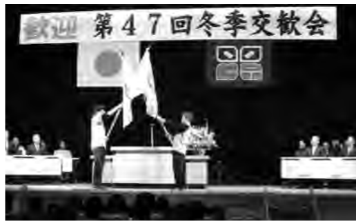
受入式 JRC 旗入場

1月23日の午後0時40分頃、明神小学校の児童64名と教職員など関係者24名を乗せたバスが文化センターに到着しました。文化センターでは、片品連合小学校の児童45名をはじめ、片品小学校の1年生から5年生までの子どもたち、保護者、村民の方々が、小旗や手を振って明神小学校の