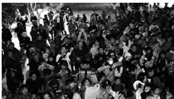
地元の方とともにスキー場帰りの方も豆まきに参加