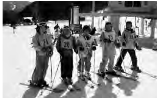
楽しかったスキー交流

アトラクションでは、尾瀬太鼓愛好会の方々に力強い演奏を披露していただき、会場を盛り上げていただきました。その後、各校に移動して歓迎行事が行われました。そして、それぞれの家庭に向かい、友情を深めることができました。