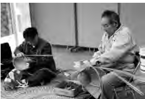
竹でざるを作っている様子