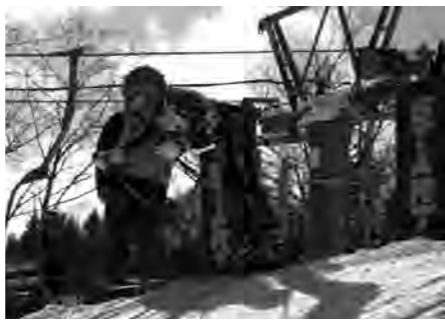
アルペン競技スタートの様子

1月28日(月)にクロスカントリー競技は水芭蕉コース、アルペン競技が、かたしな高原スキー場で行われ、両会場ですべて79名の選手が集い熱戦を繰り広げました。