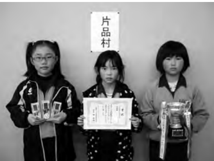
小学生低学年団体第6区子ども会