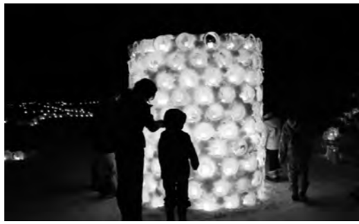
200個の灯籠を積みあげたタワー