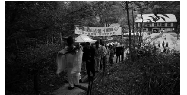
登り初めをする参加者

日本百名山に数えられている武尊山(6月15日)、日光白根山(6月20日)、至仏山(7月1日)の山開きがそれぞれ登山口で行われ、地元観光産業の発展と登山者及び関係者の安全を祈願しました。 今年もいよいよ本格的な夏山シーズンを迎えますが、登山の際は事前にしっかりと計画を立て、安全で楽しい登山をされますようお願いいたします。 (むらづくり観光課)