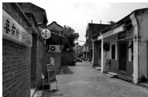
彰化懸の伝統的なレンガ造りの街並