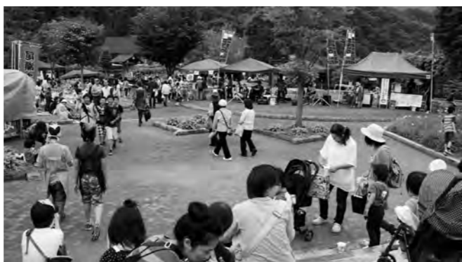
多くの人で賑わう会場