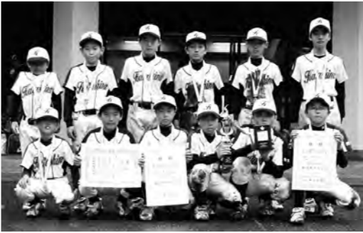
史上初の「グッドマナー賞」を受賞した選手

第48回群馬県スポーツ少年団大会（軟式野球）が5月12日（土）～16日（土）に桐生市で県内各地区の予選を勝ち抜いた24チームが参加して開催されました。片品ファイターズスポーツ少年団は利根沼田地区予選を見事に突破し本大会に進出しました。本大会は1回戦で沢小フレッツシャーズ（太田市）を11-1、2回戦では岩鼻ヤングホープ（高崎市）を8-4、準々決勝戦では赤堀野球（伊勢崎市）を6-3でそれぞれ勝ち進み、準決勝に進出しました。準決勝では優勝候補筆頭の笠懸東小イースターズ（みどり市）に敗れ、夢の関東大会出場は惜しくも逃しましたが、選手達は雨の中でも元気に、熱いプレーを展開してくれました。