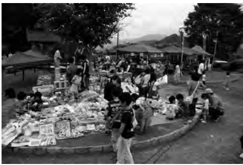
フリーマーケットの様子

7月1日(日)の2日間花の谷公園を会場に『未来へスクラム』をテーマに、ふれあいバザール宝探しin片品が開催されました。記念すべき20回目を迎え、恒例の「ちびっ子商店街」をはじめ、村民の方による模擬店などが開店しました。