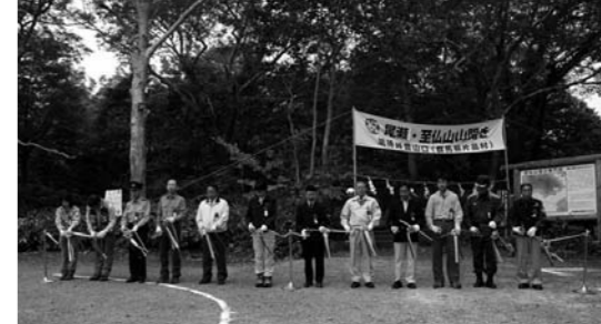
代表者によるテープカット

日本百名山に数えられている武尊山(6月15日)、日光白根山(6月20日)、至仏山(7月1日)の山開きがそれぞれ登山口で行われ、地元観光産業の発展と登山者及び関係者の安全を祈願しました。 今年もいよいよ本格的な夏山シーズンを迎えますが、登山の際は事前にしっかりと計画を立て、安全で楽しい登山をされますようお願いいたします。 (むらづくり観光課)