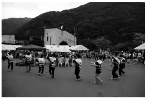
八千代民舞連による八木節

6月30日(土)前日祭・7月1日(日)の2日間花の谷公園を会場に『未来へスクラム』をテーマに、ふれあいバザール宝探しin片品が開催されました。記念すべき20回目を迎え、恒例の「ちびっ子商店街」をはじめ、村民の方による模擬店などが開店しました。