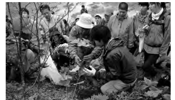
弥陀ヶ池周辺で復元作業

当日は、守る会のメンバーを始め県立尾瀬高校生や日本製紙から参加したボランティアの人たち約100人が、自然公園指導員の指導のもと、