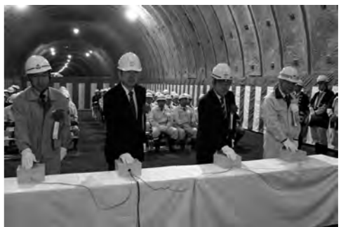
発破スイッチを押す代表者

平成23年3月に着工した国道120号椎坂バイパスの「椎坂利根トンネル」(510m)が貫通し、5月31日にトンネル内で貫通式が行われました。