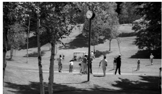
パット練習する選手のみなさん