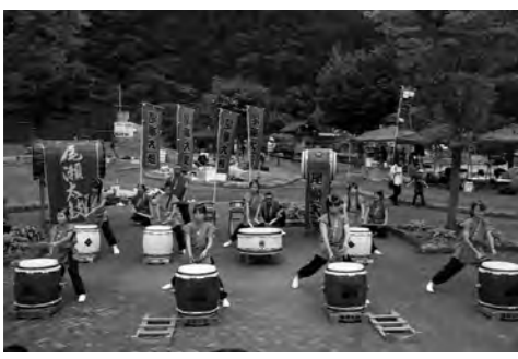
尾瀬太鼓愛好会の演奏

6月30日(土)前日祭・7月1日(日)の2日間花の谷公園を会場に『未来へスクラム』をテーマに、ふれあいバザール宝探しin片品が開催されました。記念すべき20回目を迎え、恒例の「ちびっ子商店街」をはじめ、村民の方による模擬店などが開店しました。