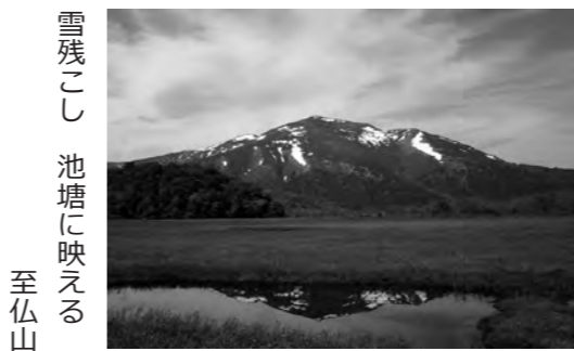
雪残こし 池塘に映える 至仏山

翌朝は、朝霧の中ガイドの方に案内してもらって、小屋周辺を鳥の鳴き声を聞きながら、植物の観察をしたりしながら、散歩しました。朝食の後、小屋を出発し、ヨツピの吊り橋を渡り、牛首・上田代・山の鼻へと戻りました。山の鼻では、見本園を見学しました。まだ流れに沿ってミズバシヨウの大群落が見られました。昼食をとり、鳩待峠に