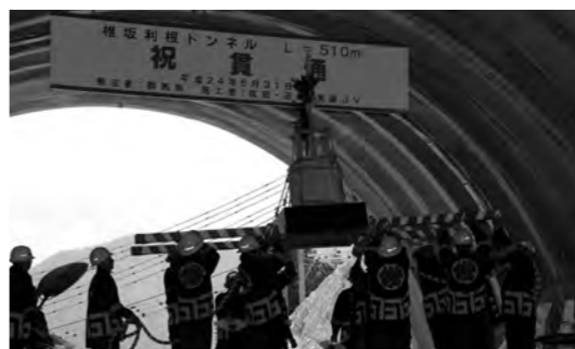
トンネル内を渡御する樽神輿

貫通式には関係者約100人が出席。沼田市長・片品村長など代表者が発破のスイッチを押す、轟音と共に貫通となりました。通り初めをした関係者は貫通点で握手や万歳で貫通を祝い、樽神輿の渡御で式典を盛り上げました。