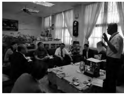
関係者に片品村の説明をする様子

他にも台湾スキー連盟の『陳雲銘』理事長とのスキーキャンプ開催に向けた協議や台湾自転車協会『陳春發』