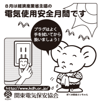
8月は経済産業省主題の電気使用安全月間です。プラグはよく手を抜いてから抜きましょう! http://www.kdh.or.jp/ 関東電気保安協会

求職登録および就職のあつせん ○福祉資格等の相談 ○福祉関係事業所の求人随時受付中 ▼問い合わせ先 群馬県福祉マンパワーセンター 027(255)6600 高崎市福祉人材バンク 027(324)2761 太田市福祉人材バンク 0276(48)9599