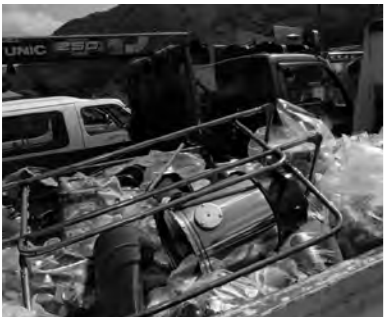
清掃活動で回収された粗大ごみ

今年も携帯電話の災害情報共有システムを使って現場の情報を更新しながら作業を行いました。みなさん大変お疲れ様でした。