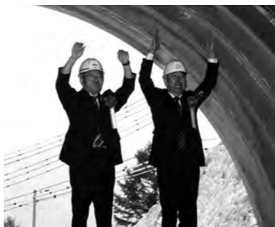
万歳で貫通を祝う沼田市長と千明村長

平成23年3月に着工した国道120号椎坂バイパスの「椎坂利根トンネル」(510m)が貫通し、5月31日にトンネル内で貫通式が行われました。