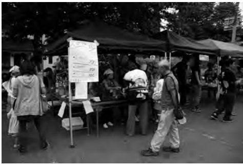
子ども商店街の様子