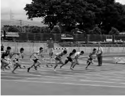
100m 競技スタートの瞬間