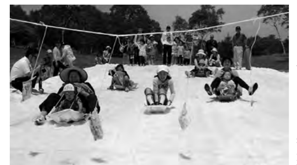
残雪のゲレンデでパン食い競争

会場では村民によるハンバーガーやラーメンの店や、恒例になった残雪のゲレンデソリのりやパン食い競争・宝探しなどが行われました。天候に恵まれ、武尊牧場の三合平は満開のレンゲツツジを楽しむお客様で大盛況でした。ご来場いただいた皆さん、関係者の皆さん、大変お疲れ様でした。(むらづくり観光課)