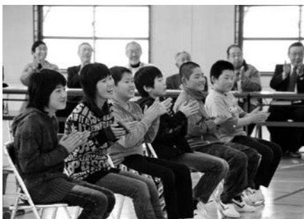
発表を笑顔で見る武尊根小卒業生

3月1日(木)片小・武尊根小、2日(金)南小、7日(水)北小で6年生を送る会が行われました。 合奏やダンス、劇などを1年生から5年生が6年生にありがとうの気持ちを込めて発表しました。