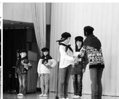
武尊根小鼓笛隊引継式