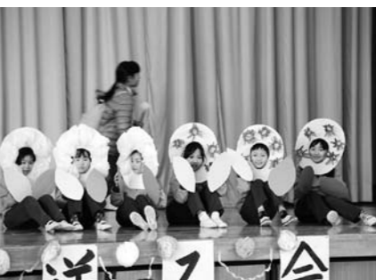
北小1・2・3年生(劇)尾瀬物語