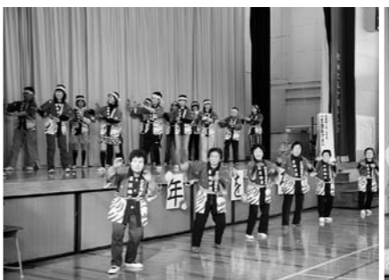
北小5・6年生と地元の方で土出おけさ

また、南小・北小では地域の方も参加して歌やおけさで卒業を迎える6年生を祝いました。(むらづくり観光課)