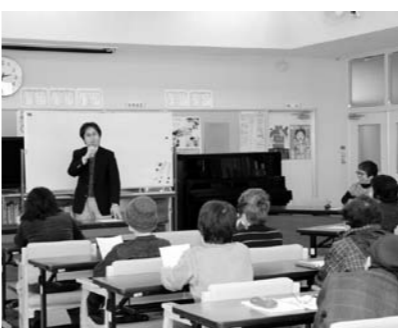
多くの方に参加いただいた講演会