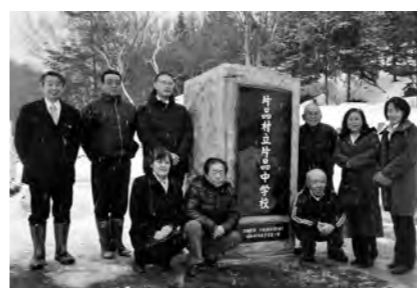
昭和41年度卒業の幹事他

春からグランドゴルフが始まると病院通いの人が少なくなるのは、健康によい証拠なのでいいことだね。人口減少・少子化・就職難など抱える問題が多いが、若者が希望を持って生活が送れる社会になるようにみんなで力を合わせて取り組んでもらいたい。《今思うと忙しいってことは幸せだったのかなあと思うよ》