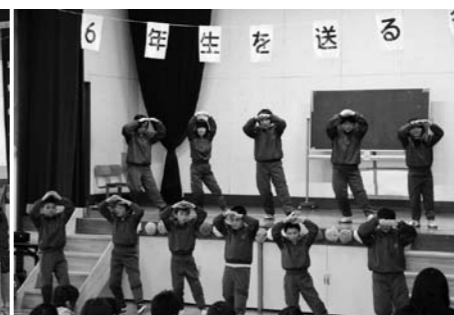
南小3・4年生(劇)南小の一年