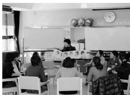
講義を受けるお母さんたちの様子