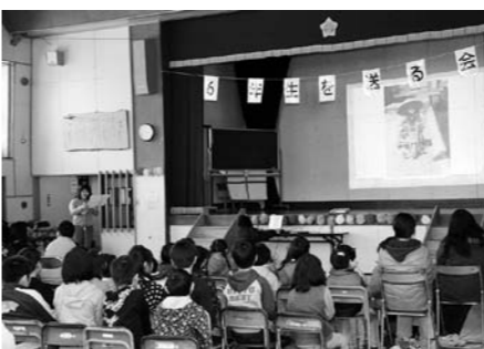
思い出の写真をしながら作文朗読