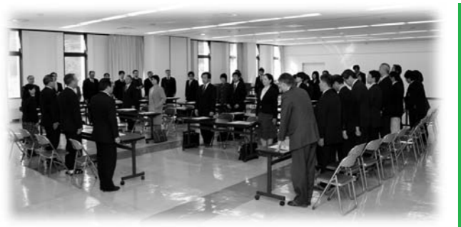
教職員辞令交付式の様子