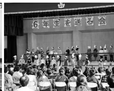
片小2年生(合奏)森のたんけんたい