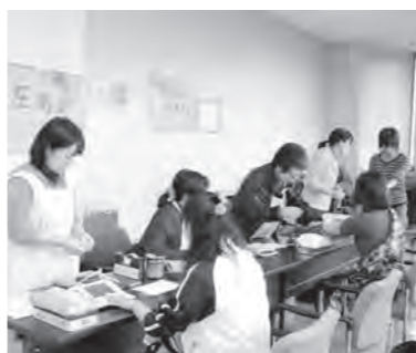
健康相談会場の様子

「大切な資源 有効利用で健康づくり・環境づくり」をテーマに、体と環境に優しい商品の販売や農産加工コンクール、健康相談等が行われ、多くの皆さんに楽しんでいただきました。 役員関係者のみなさん大変お疲れ様でした。 (むらづくり観光課)