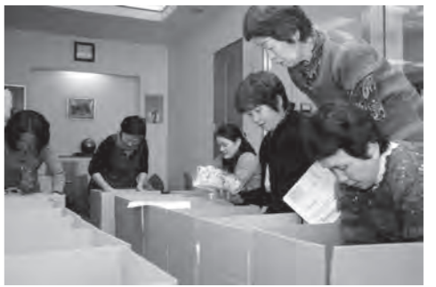
ふるさと便の箱詰めをする女性部のみささん

11月7日(水) 商工会にて『片品ふるさと便』の発送準備が行われました。 このふるさと便は、片品村内に避難していた南相馬市の方にアンケート調査を行い、希望のあった方に対して片品村の味を発送する事業です。 9月から始まり、今回で3回目になりました。 野菜・りんご・キノコの盛り合わせなど、9品目のほか、商工会長より、うどんと女性部長手作りこんにやくが詰め合せられました。