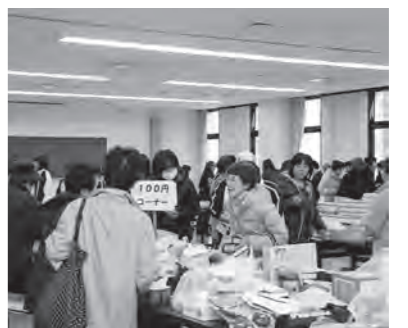
バザー会場の様子

11月20日(火) 役場2階において福祉バザーが開催されました。村民の皆様が寄附していただいた多くの品物を各