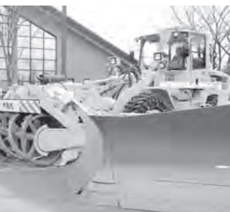
平成 24 年度社会資本交付金で購入