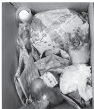
中身が盛りだくさんのふるさと便

第2のふるさと味の通じた交流がさらに広がることを期待しています。 (むらづくり観光課)