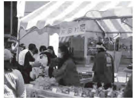
ぐんまの山村フェア会場の様子

埼玉県蕨市、上尾市で開催された「蕨宿場まつり(11月3日)」、「上尾産業祭(10日)」、「上尾シティーマラソン(18日)」、また金精峠を挟んで親交のある栃木県日光市の「日光そばまつり(23日~24日)」で特産品販売や観光パンフレットの配布を行い片品村の宣伝活動を行ってきました。 他にも、11月2日には東京都区政会館で「ぐんまの山村フェアin東京」が行われ、大勢の来場者に片品村のPRを行うことができました。 (むらづくり観光課)