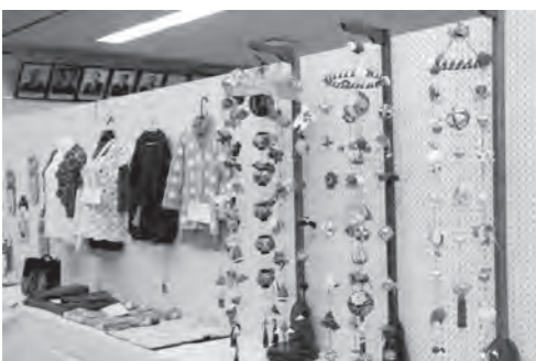
民芸の部コーナーの様子