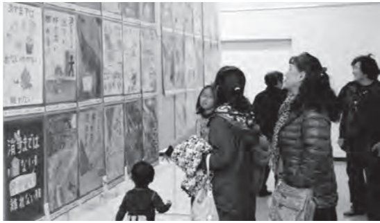
多くの方が来場した文化展

ら4日の搬出片付けとご協力いただいた役員関係者の皆さんに心から感謝申し上げます。 (教育委員会)