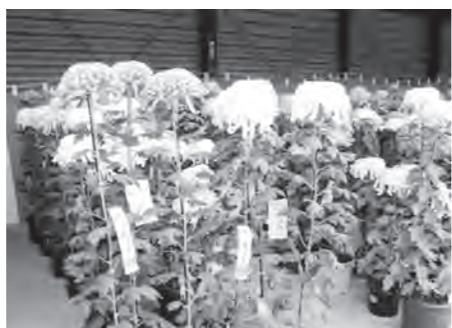
菊花の部 左議長賞 右村長賞

ら4日の搬出片付けとご協力いただいた役員関係者の皆さんに心から感謝申し上げます。 (教育委員会)