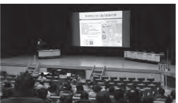
防火講習を受ける組合員のみなさん

また11月15日(木)には文化センターにて民宿、旅館、ペンション組合6団体による防火講習会が開催さ