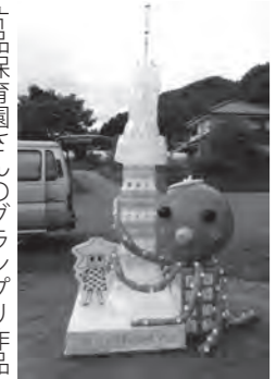
片品保育園さんのグランプリ作品 (花の駅)