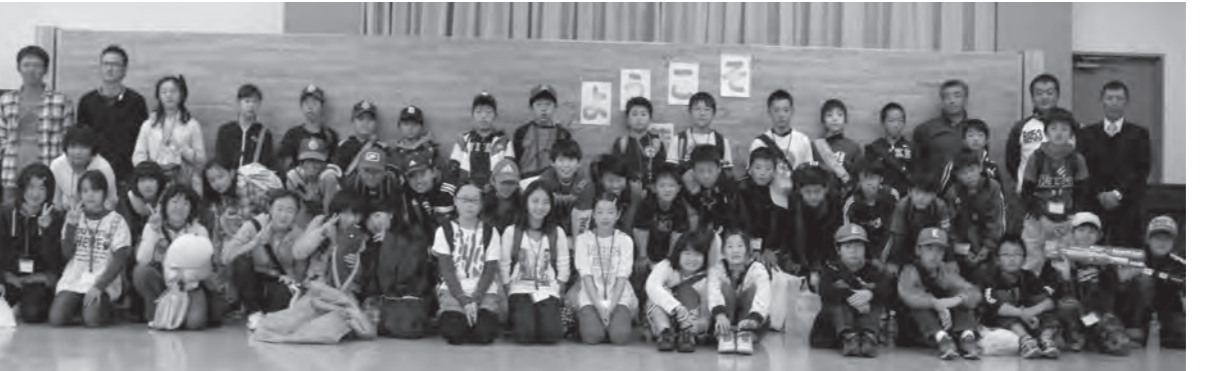
交流会へ参加した皆様大変お疲れ様でした。(教育委員会)

普段スポーツ活動をしている少年団ですが、スポーツ以外の交流もあり、皆さんの思い出ができたのではないのでしょうか。