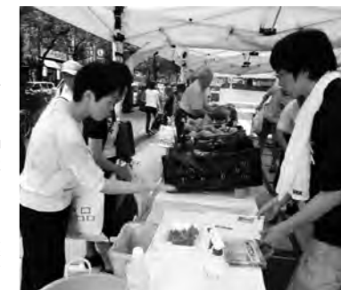
グリーン・ツーリズムフェアの様子

また、8月25日(木)、26日(金)の2日間は東京日本橋で「農産物&グリーン・ツーリズムフェア」を開催し、農