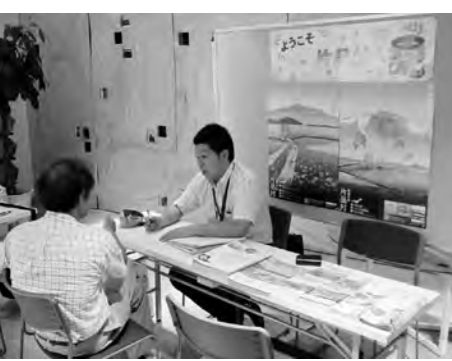
片品村について話し合う移住希望