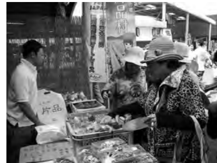
川口たたら祭りの様子

8月6日(土)、7日(日)の2日間、埼玉県蕨市(わらび機まつり)・7日(日)埼玉県川口市(川口たたら祭り)において 旬のトマト、トウモロコシをはじめとした高原野菜、「尾瀬ブランド」に認定されている加工食品、「平成の名水百選」に認定されたミネラルウォーターなどを販売して片品村の「味」をPRしてきました。