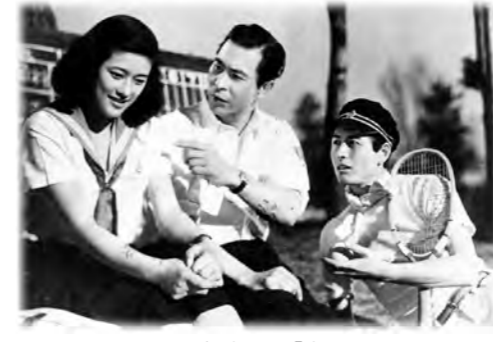
昭和24年作品 「青い山脈」

文化庁の優秀映画鑑賞普及事業として、近代日本の光と陰を情感ゆたかなりアリズムで描いた作品を2本上映いたします。