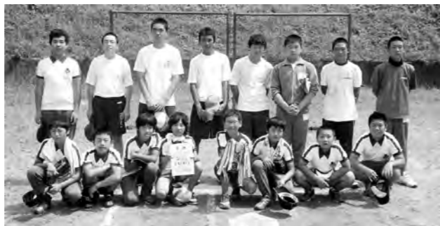
ソフトボール優勝 第8区子ども会