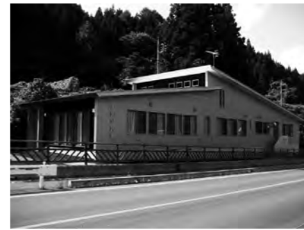
移転した新しい土出公民館

我が家では3世代同居だが、Uターンで帰ってきた若い人も就職の場がなく、また村から出てしまう。周りにあった田畑が高齢化により荒廃が進んでいくのが心配。 《仕事が増えて、村に元気が出るといいな～》