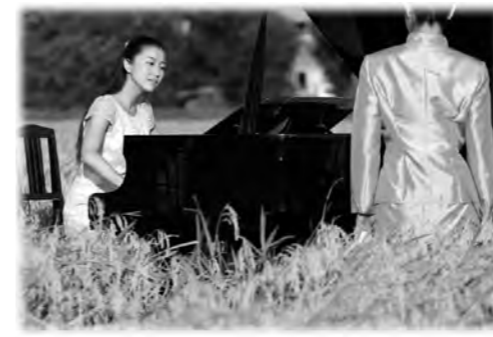
平成22年作品 「アンダンテ」～稲の旋律～