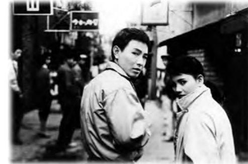
昭和29年作品 「純愛物語」