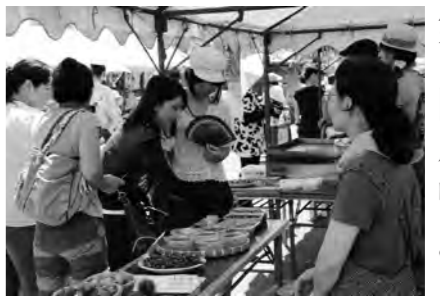
グランプリ目指して熱戦が繰り広げられる

8月28日(日)寄居山公園を会場に「片品トマトまつり」が開催されました。このまつりは、片品村の農産物の発展とPRを目的として有志が集まって企画されたものです。