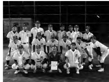
優勝した第5区の皆さん

8月1日から11日にかけて片品中学校校庭を会場に、第20回区対抗野球大会兼平成23年度町内対抗野球片品予選会が開催されました。 決勝戦は5連覇を目指す第8区と5連覇の後4年間優勝から離れていた第5区との対戦となりました。 初回に2点を先制した5区に、3回、6回と1点ずつ8区が得点するという緊迫した投手戦が展開されました。 最終回の7回裏、一死三塁から5区がサヨナラスライズを決め優勝の栄冠を手にしました。 優勝した第5区は9月18日からみなかみ町月夜野総合グラウンド野球場で開催される第57回群馬県町内対抗野球利根沼田支部予選会に片品村代表として出場いたします。 ご健闘をお祈りします。 また、審判員並びに各区役員、選手の皆さん大変お疲れ様でした。