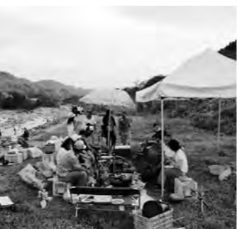
片品川でのバーベキュー