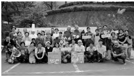
出展・関係者のみなさん