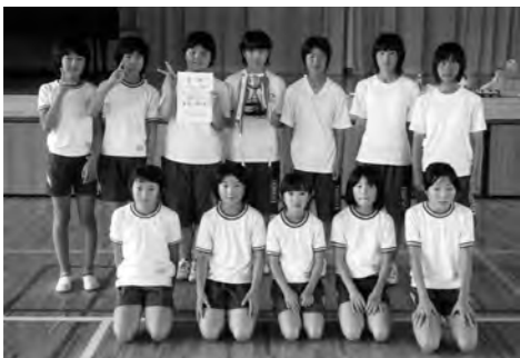
ドッジボール優勝 第2区子ども会