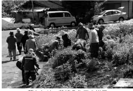
草むしり・花植え作業の様子

成され、年8回の役員会などを行い、年間の行事や作業計画を立てているそうです。奉仕作業として、4月から10月未までの間、笠科神社・住民センター・消防詰所・鎌田ロータリー周辺の草むしりや花植え作業など行っています。