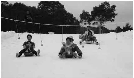
ソリ乗りゲレンデでパンくい競争

ソリ乗りゲレンデを作りパン食い競争などが行われました。会場に集まった皆さんはこの時期に触れるたくさんの雪に大喜びでした。開花の遅れが心配されたレンゲツツジも満開で見ごろを迎え、ご来場いただいた方々も記念撮影などしながら、ゆつくりと観賞いただきました。一日天候にも恵まれ、武尊牧場は大賑わいでした。ご来場いただいた皆さん、関係者の皆さん、大変ご苦労様でした。