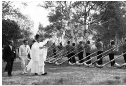
武尊山山開きで初演奏を行った花咲アルプホルンクラブ