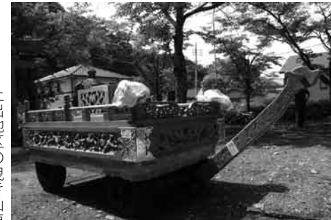
土出地区の曳き山車

このたび、片品村では、平成22年度コミュニティ助成事業の助成を受け土出地区お祭り用品(曳き山車)を購入しました。 この事業は(財)自治総合センターの行っている事業でコミュニティ活動を促進し、その健全な発展を図るとともに、宝くじの普及広報事業を行うために、自治宝くじの収益金の一部が助成されるものです。 土出地区の行事に積極的に活用され、地域の連帯感や、自治意識の向上に役立てて頂きたいと思っております。