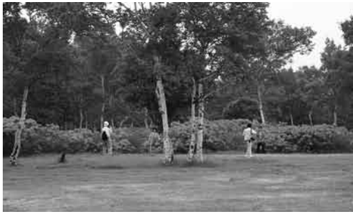
満開のレンゲツツジ

6月20日(日)武尊1500mフェスティバルが武尊牧場三合平を会場に行われました。今年で第24回を迎えたこのお祭りは、武尊牧場のレンゲツツジが見ごろを迎える時期に行われます。