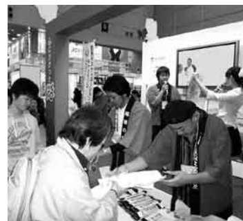
群馬県ブースで片品村をPR

また、3日目には、片品村の湧水などが当たる無料抽選会が3回にわたって行われ、会場を盛り上げました。