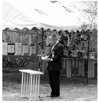
祝辞を述べる日光市長

日本百名山に数えられている至仏山(2228m)日光白根山(2578m)上州武尊山(2158m)の山開きがそれぞれの登山口で行われ、地元の観光産業の発展と登山者及び関係者の安全を願う催しが行われました。