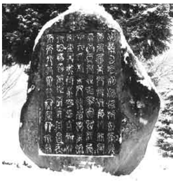
禹王の碑冬期間の様子

先人が残してくれた立派な文化遺産を大切に保存すると共に、村の発展の為に大いに活用し文化に観光に寄与することを願っています。