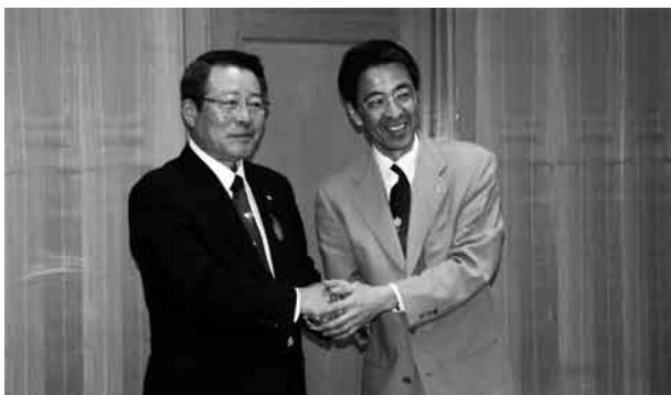
来村の際の村長（左）と開成町長（右）