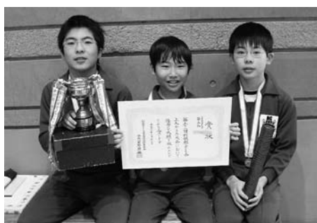
小学高学年の部3位入賞の鎌田子ども会