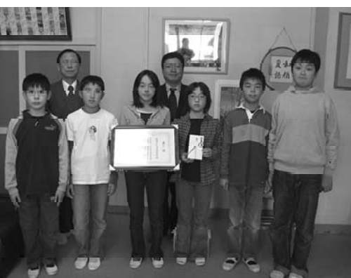
(環境委員のみなさん平成19年12月12日校長室)

この事業は、社団法人食品容器環境美化協会が環境教育支援事業の一環として、散乱防止・リサイクルの実践教育に優良な成果をあげている小・中学校を表彰するものです。片品小学校のアルミ缶・牛乳パックのリサイクル活動が高く評価され今回の受賞となりました。