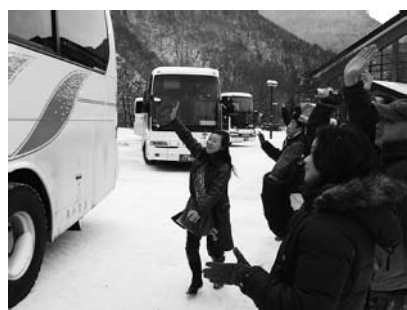
思い出を乗せたバスを見送る関係者

最後になりましたが、片品村、片品村教育委員会をはじめ交歓会関係者のみなさんに心より感謝申し上げます。