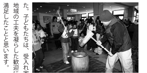
スキーの後もちつき

いよいよバスの出発時間になりました。最後の記念写真撮影や談笑にも名残り惜しそうでした。