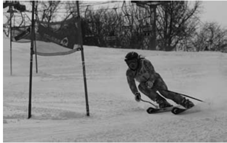
ミスのないターン