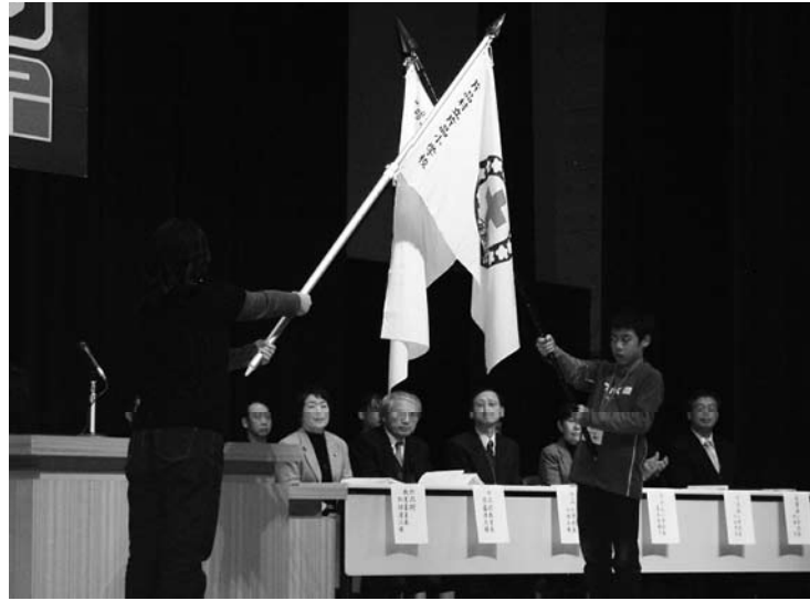
受入れ式の様子 (JRC旗の入場)