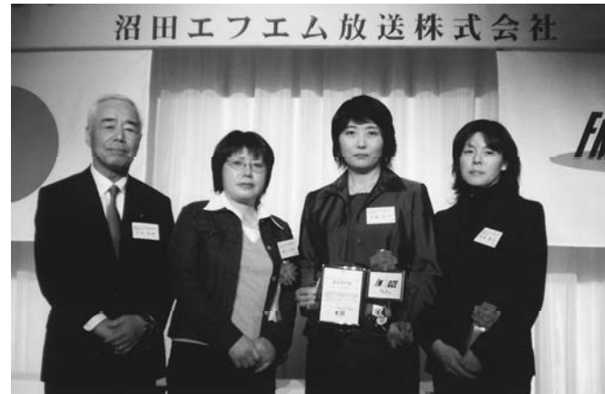
(大賞授与式 平成20年1月23日 於：ホテルベラヴィータ)

沼田FM放送株式会社、エフエムOZEが主催する「第6回エフエムOZEハートウォーミング大賞」の部門賞(教育部門)に片品小学校のかがやき支援センターが選ばれました。エフエムOZEハートウォーミング大賞は利根沼田地域において、文化・芸能・スポーツ・ボランティアの各分野を通して、地域の発展に貢献された団体及び個人の功績を称えるとともに、今後のさらなる活動を奨励するためにエフエムOZEが設立した賞です。