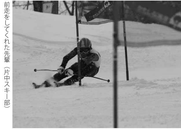
前走してくれた先輩(片中スキー部)

1月27(日)に第35回片品村スポーツ少年団スキー大会兼第31回小学生総体片品予選会が開催されました。