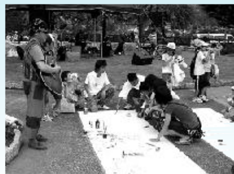
ライブペインティング