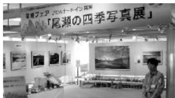
会場を飾った尾瀬の写真