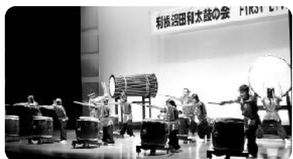
チームワークが良かった尾瀬太鼓愛好会

演奏前にボランティアの司会者が参加団体を丁寧に紹介し、和太鼓に対する思いを感じながら演奏を聴くことができました。片品村からも尾瀬太鼓愛好会が参加し元気な演奏を披露してきました。