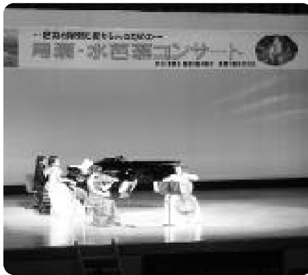
3人の奏でる美しい音色が観客を魅了

片品村で文化と自然を楽しんでいたところ、6月16日(土)片品村文化センターにおいて「尾瀬水芭蕉コンサート」を尾瀬林業(株)と共催で開催しました。演奏者トリオ・デュ・ポローニアの3名は、桐朋学園大学音楽学部4年生で、クラシック風にアレンジした「八木節」や「夏の思い出」など普段聴きなれた曲を中心に全12曲を演奏し観客の皆さんを魅了してくれました。