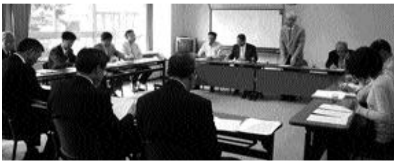
片品村キャリア・スタート・ウィーク実行委員会 (H19.6.14)

を通して、学ぶこと、働くこと、生きることの尊さを実感し、望ましい勤労観、職業観を育み、社会人・職業人として自立していくことができるよう、発達段階に応じたキャリアを形成させるため、皆様のご指導ご協力をお願いいたします。