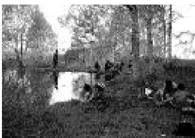
自然観察会・武尊牧場 (H19.6.5)

然観察会は、武尊山と尾瀬を題材とし、片品の豊かな自然についての知識を深めるとともに、大切にしようとする態度を育てます。また、環境講座は自然とともに生きていくために必要な知識を学び、考え、実践していくための学習です。 もう一つは、郷土を知るための学習です。各学年の校外学習や、文化財巡り、片品文化の日の弟子入り、職業体験など人との触れ合いを通して学習します。これらの中で、他地域のよさとともに片品の