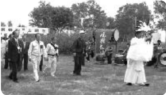
尾瀬太鼓の演奏で登り初め