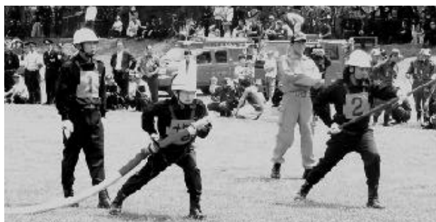
小型ポンプの部 第1分団

平成19年度利根沼田支部消防ポンプ操作法競技会が、6月3日(日)沼田公園グラウンドにおいて開催されました。