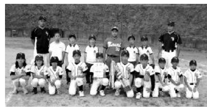
片小ファイターズ