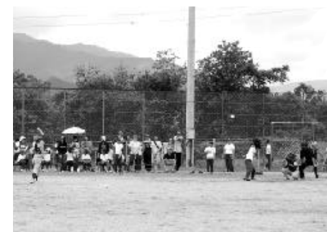
2部大会 優勝 片小クロカン 準優勝 片小アルベン