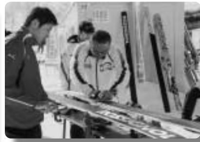
助走スピードを左右する板の手入れ