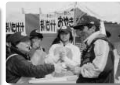
好評だった婦人会員・おやき