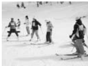
楽しかったスキー教室

「片品の皆さんのたくまじさを見るのができました!」とお褒めの言葉をいただきました。