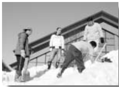
ベテラン揃いで作業も楽しい

のレーンを造りました。商工会青年部員、またOBの各事業所で所有する建設機械で作業する部員達と、スコップ片手に汗びつしよりになり固く締まった雪と格闘する部員達との連携もすっかり慣れたものとなりました。決して芸術作とはいえませんが、参加した部員それぞれが思いを込めて完成させました。来年以降もこの雪像造りの企画を継続し、子供達にとつて忘れられない思い出となる交歓会が、一層印象深くなればと考えております。出来ましたらご父兄や子供達のご協力、また新しいアイディアなど頂けましたら幸いです。