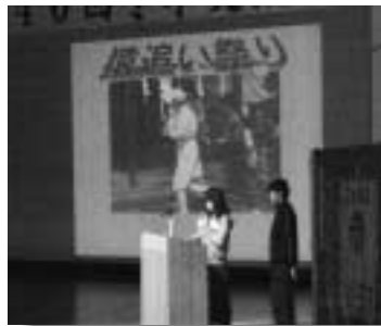
地域の特色を発表