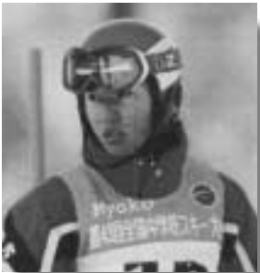
熱心なコースの下見