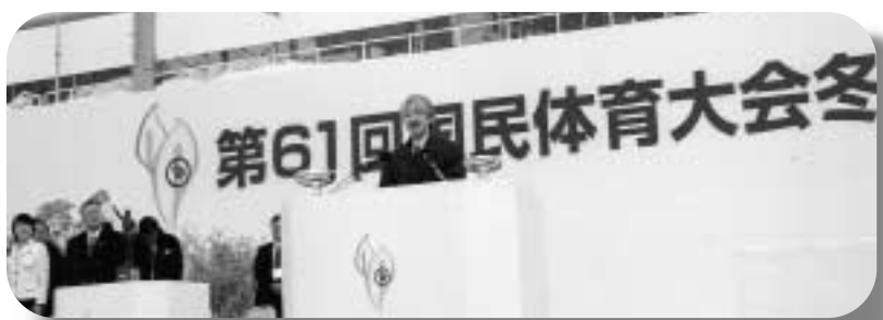
尾瀬国体開催にお祝いと選手団約2000人に激励のお言葉を述べられた秋篠宮様