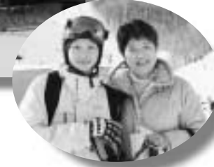
九州から娘の応援に駆けつけたお母さん