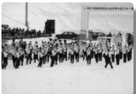
素晴らしい演奏の川場小学校マーチングバンド