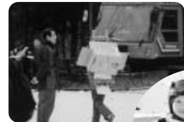
背負子で弁当配達(CC会場)