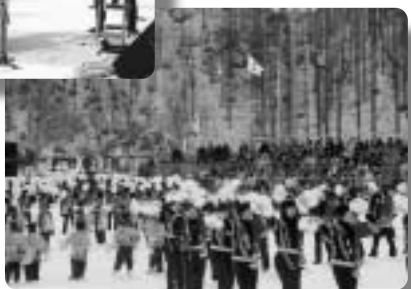
八木節の音頭で踊る婦人会員と保育園児