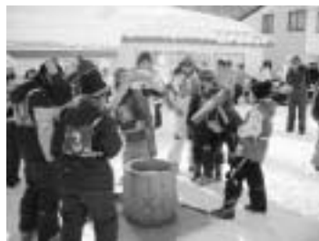
雪上の餅つき体験