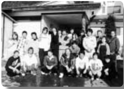
お世話になった宿舎の前で山梨県選手団