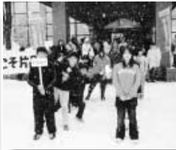
片品らしい雪のお出迎え

夏の交歓会以来、半年ぶりに再会した子供たちは、数年来の親友のように旧交を温めていました。