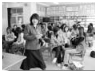
和やかな感じの会場

コーチ・応援してくれた皆さんに感謝したいです。来シーズンからも全国で戦えるように頑張りたいです」と話してくれました。