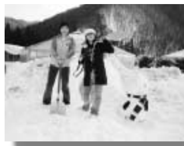
完成したかまくらの横で笑顔

このお二人、ある音楽家の口ケ地となった片品村へ追っかけとして来たのが始まり。昨年1