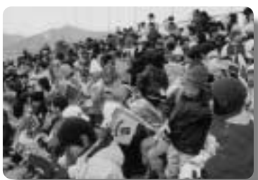
小学生は都道府県マークの入った旗で応援