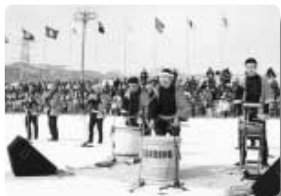
会場内にこだました八木節愛好会の見事な音頭