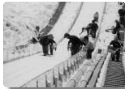
手作業の多いジャンプ台