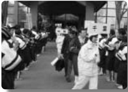
閉会式後選手団を見送る群馬県選手・役員