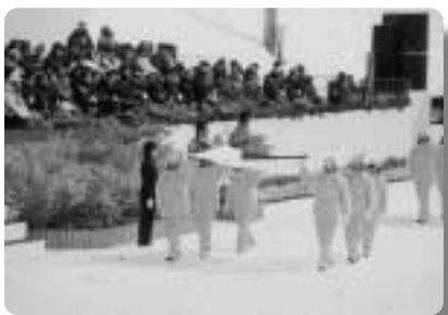
国旗を持つのは村内スポーツ少年団員