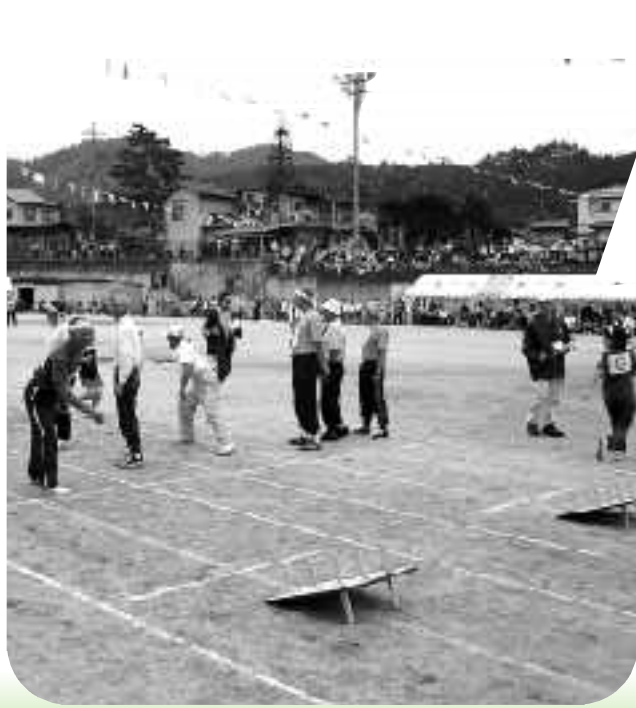
新種目の輪投げリレー