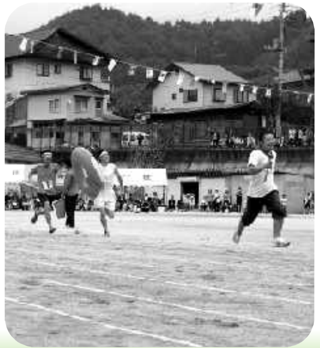
予想どおりにいかない抽選競争