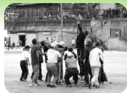
声を合わせてヨイショ!!