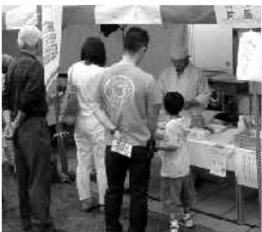
片品村民運動会と日程が重なった尾瀬ドーフさんが出店してくれた。