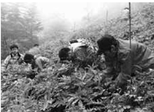
弥陀ヶ池付近で作業する皆さん

9月14日(木)シラネアオイを守る会が白根山でシラネアオイ種子採取及び清掃登山を行いました。