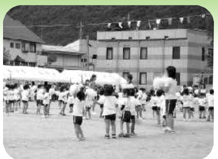
かわいい保育園児の遊戯