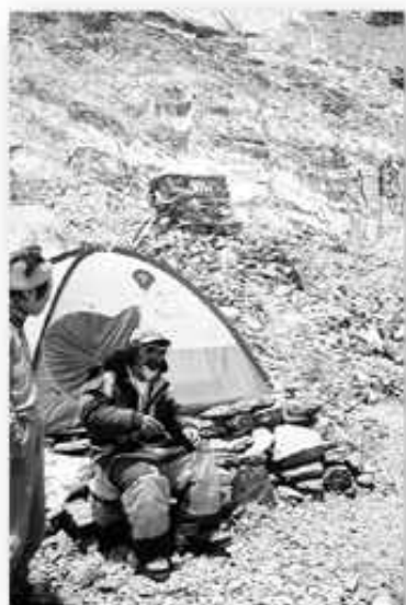
チョモランマ6500mキャンプで

真冬の高所登山、それも氷壁は想像以上に硬く難しい、そうとうな体力が必要だ。又、普段体験した事のない風が吹き荒れ、テントや荷物など飛ばされることも珍しくない。人間だって油断していると飛ばされる。そんな苦勞をして