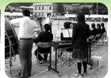
尾瀬高吹奏楽部の演奏