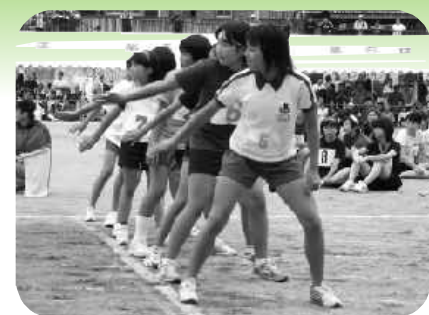
区対抗リレー女子