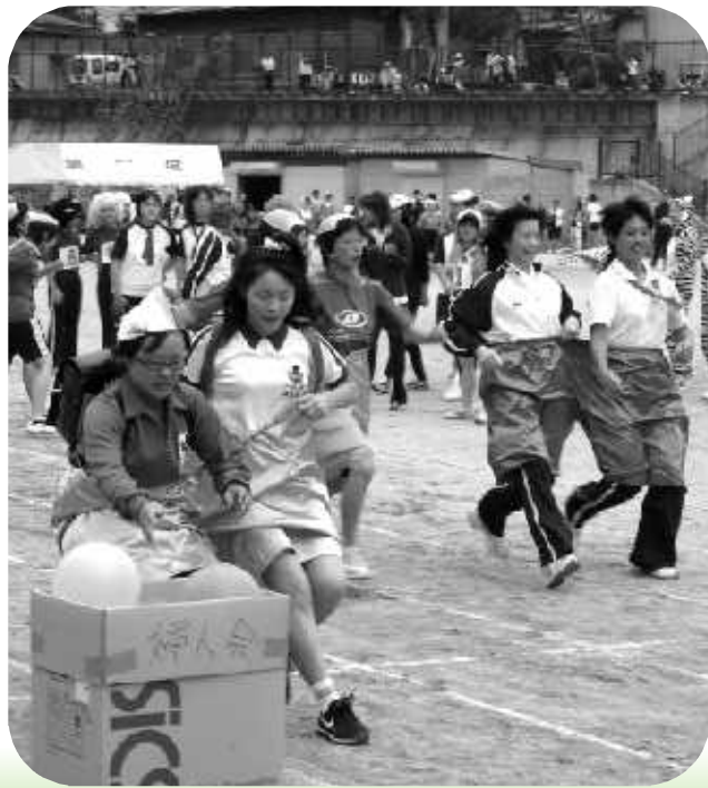
婦人会リレーは今年も楽しかったです