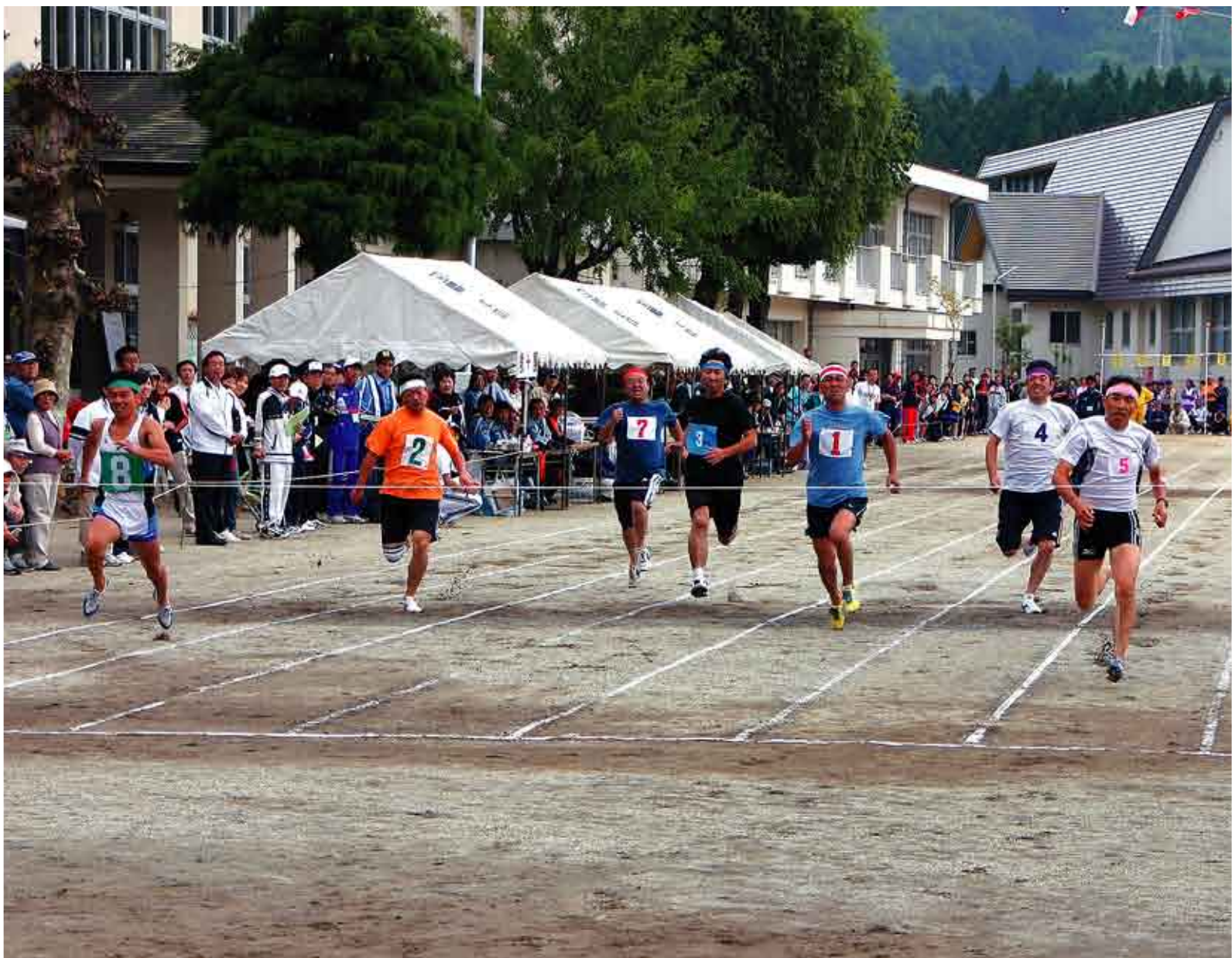
(9/17 片品小学校グラウンド)

村民運動会の60メートル走は、スタートからゴールまで選手も観客も気が抜けません。7秒台で駆け抜けていくのですから。来年も、皆さんの力走を楽しみにしています。