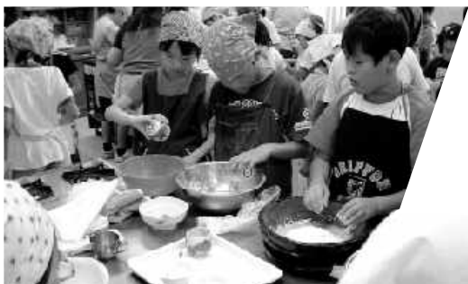
まずは粉をこねる

今ところ図書の種類や数はまだまだ不十分ですが、ぜひお立ち寄り下さいまして、ご意見などをいただければ幸いです。