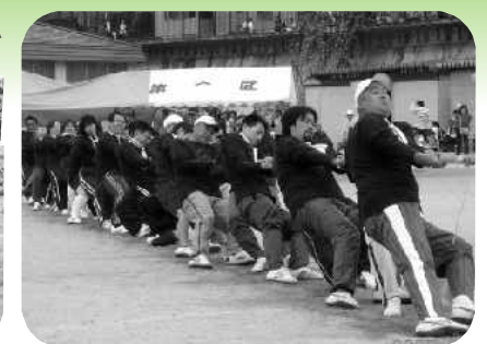
応援にも力が入る綱引