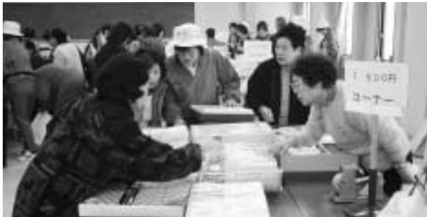
品物をしっかり確かめる来場者

なお、バザー収益金につきましては社会福祉協議会へ寄付いたします。ご協力を頂いた村民の皆様感謝申し上げます。また、婦人会役員の皆さん、早朝よりご苦労様でした。