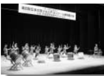
5番目の演奏の尾瀬太鼓愛好会

くじ」の収益金等を財源として、助成されるものです。第三区の行事に積極的に活用され、地域の連帯感の向上や、自治意識の向上に役立つことを期待します。