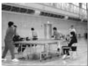
スピードのある試合が多かった

十一月六日(日)、片小体育館を会場に村民卓球大会が開催されました。大会では、小学生、中学生から一般まで七十二名の選手が参加し、終日熱戦が繰り