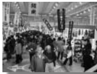
アメ横通り並みの人出

この催しは、(財)電源地域振興センターが、電源地域市町村(発電所などが所在する市町村)で努力と創意工夫によって生み出された特産品などの販路拡大を支援し、電源地域の振興とその社会的役割について電力消費地(主に首都圏)で理解促進を図る目的で毎年開催されています。