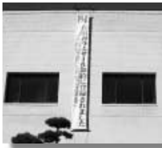
庁舎外壁に懸垂幕が垂らされた

これにより国際的に尾瀬の名前が知られ、更に尾瀬の貴重な自然を保全しつつ、環境学習をはじめとする適正な利用の推進が図られるでしょう。