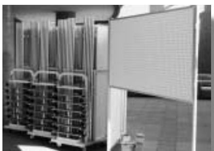
購入した展示用パネル

この事業は(財)群馬県市町村振興協会の行っている事業で、コミュニティ活動を促進し、その健全な発展を図るとともに、宝くじの普及広報事業を行うために、「サマージャンボ宝