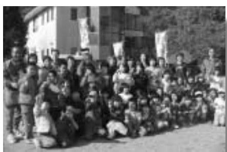
どろだんごを作り終えて記念撮影

「うんだん」 11月13日 鎌田住民センターの庭で「光るどろだんご」をつくりました。ぴかぴか、つるつる、かちかちのどろだんご作りにみんな熱中しました。なんと片品で「AKラス、マリンプールのどろだんご」ができたのです。おっちゃんは「超AKラス」と言っていました。簡単にはだてていました。簡単にはだててはいらないです。とにかくつるつるで、自分の顔がどろだんごに映るくらいぴかぴかで、でこぼこがないものでした。 おめでとう!!小学生で初めてかもしれません。