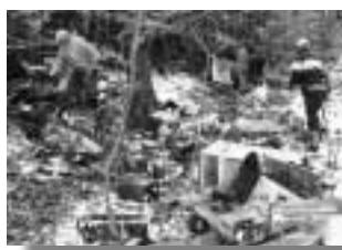
2次災害を招くような粗大ごみ

今回はその中の「自然」と「暮らし」の班の活動の一部を紹介いたします。「自然」の班は地域をきれいにすることがまずは大切と、十一月二十日午後から宇条田峠周辺の粗大ごみの撤去を行った。「予想していた以上のごみの量であったがみんなが気持ち良く参加してくれた。道路や川沿いがきれいになった