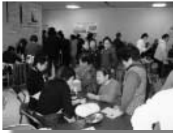
血圧をはかってもらう来場者

況のうちに終了することができました。協力していただいた各団体の皆さん、大変ありがとうございました。(むらづくり観光課)