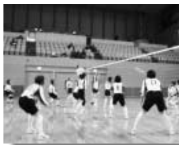
県民体育大会に出場したバレーボール女子