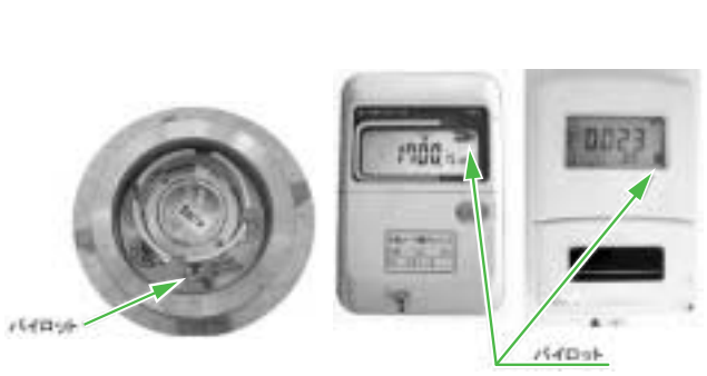
《問い合わせ先》生活環境課 水道係 58-2114

水道事業は、民間の会社と同じように「独立採算」で運営されています。水を作るための費用は、一般行政のように税金ではなく、皆さんがお支払いいただく水道料金で支えられています。 ご家庭などの水道設備は個人の財産であり、個人の責任で管理していただくものです。たとえ漏水していても、水道メーターで計量した水量に対する料金はお支払いしていただくこととなります。(しかし、事情によって減額できる場合もあります) なお、漏水の発生は、早期に修理して下さいます。漏水は初めのうちはわずかでも日ごとに多くなり、貴重な水を無駄にするだけでなく、料金も高額になります。また、ご家庭でも漏水確認ができます。水道を使っていない状態でメーターが回り続ける状態