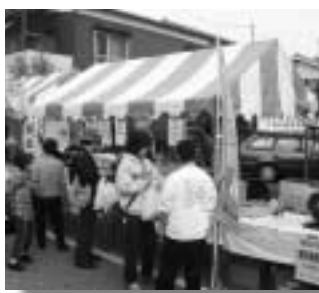
宿場まつり片品用テント

まつり会場は、市の農業共進会や工業フェア、フリーマーケット、模擬店と即売コーナーなど催し物いっぱい、多くの来場者が訪れました。