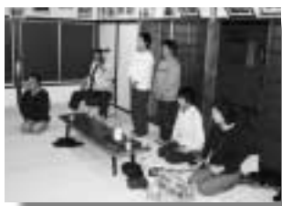
暮らしの班が改修した旧住民センター