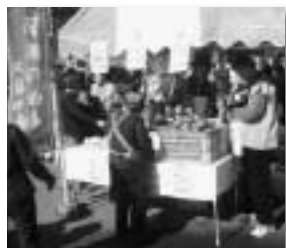
評判の良かったりんご

こうしたお祭りに参加した片品村は、来場者に、村の観光パンフレット配付と、特産品の販売を行い、片品村の観光ピーアールを行いました。