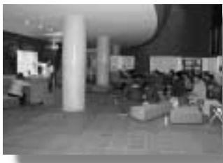
各団体発表の様子