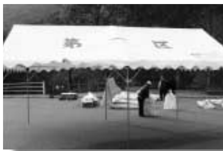
各区に配布された集会用テント

このたび、片品村では、平成十七年度コミュニティ助成事業の助成を受け村内各地区に集会用テント用具等(文化学習活動用品の整備)を購入しました。この事業は(財)自治総合センターの行っている事業で、コミュニティ活動を促進し、その健全な発展を図るとともに、宝くじの普及広報事業を行うために、自治宝くじの収益金の一部