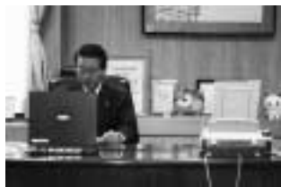
メール用のパソコンとファックス (右)

ファックス番号 0278(58)3354 e-Mail:mayor@vil.kakashinagunma.jp sounu@vil.kakashinagunma.jp