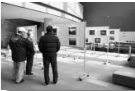
審査会后、文化センターロビーで写真展が開催された