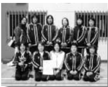
優勝した1支部Fチーム