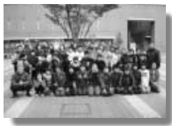
川口市科学館前で

団員は、スポーツ交流大会に参加し、SKIPシティ(川口市立科学館)を見学してきました。スポーツ交流大会のリレー種目では、見事優勝しました。蕨