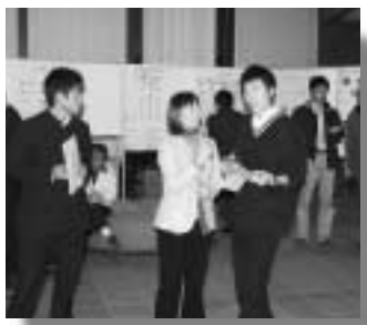
交流会でインタビューを受ける尾瀬高生

平成十五年、県の地域興しの新しい事業として、ぐんま文化観光社・片品が創立され、始めての事業として、片品村の宝さがし事業が開催されました。私達村民の意識しなかったことが、新しい宝として気がついたり、発見されたりしましたが、その事業の呼び水としては、平成三年に始まった、尾瀬太鼓愛好会や、平成五年に組織された「エンジンジョイネットワーク片品」等の活動が大きな要因になったと思います。このことが一つの契機となって、各地域それぞれの場所様々な事業が自発的に動き始めました。現在活発な活動をしている十一の団体がその活動の様子をパネルを使って発表したり、意見を交わしたりしようというこの交流会。各会それぞれに充実した発表、今、若い人が新しい村づくりにそれぞれ