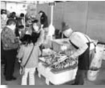
年を重ねるごとに増える出店