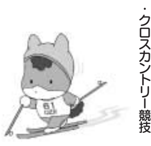
・クロスカントリー競技