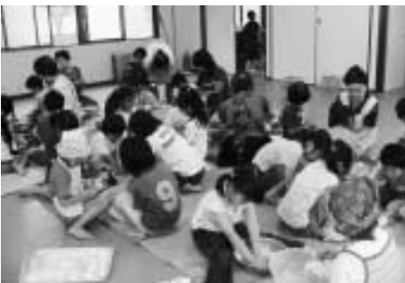
よそ見もせずに粉をこねる子ども達

て、「やきもちづくり」が行われました。講師は、地域のお年寄り。長年の経験で培った力を發揮し、子ども達に「やきもち」の作り方を教えていました。子ども達も粉をこね、あんこなどをに入れてまるめ「やきもち」作り挑戦しました。できあがった「やきもち」は200個以上。その「やきもち」を参加者全員、おいしそうに食べていました。 講師のお年寄りは、「子ども達と一緒に活動するのはいいねえ。若返るような気がする。」と話していました。