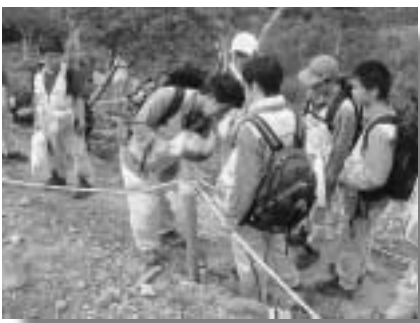
保護柵を設置する尾瀬高校生