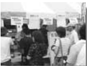
片品村農協出店の尾瀬びるキョウサ

九月三日(四)に県民広場において、「ふるさと自慢 てんこ盛り」をキャッチフレーズに、農産物や加工品などの展示即売や実演・体験などが行われ、片品村農協と尾瀬ドーフが参加しました。