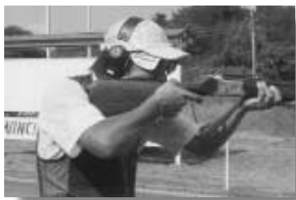
今月の国体は1組1番で初弾を射つ

平成十二年、群馬県クレー射 撃協会入会。入会した年から国 体予選を兼ねた競技会に出場し