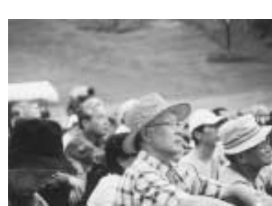
中央帽子の人の左が群馬県知事