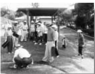
講師の説明に真剣な参加者