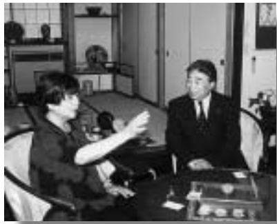
俵萌子美術館にて