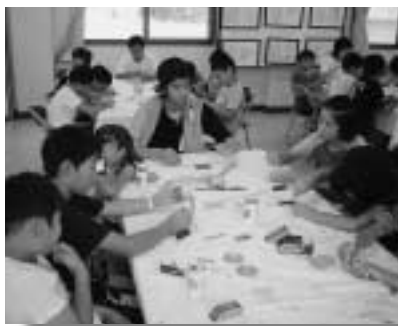
班員を見守る高校生リーダー

ウォークラリー、炊飯体験、読み聞かせ、浅間火山博物館の見学、吾妻峡でのハイキング、天体観測、蛾の観察、竹とんぼづくりとほぼ予定どおりの日程で活動することができました。活動中、高校生リーダーはいつも班員のことを考え、進んで活動していました。高校生リーダーのもとで活動した三日間は、よい体験になったと思います。