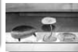
▲シールドトレイとキャンドルトレイ