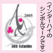
インターハイのシンボルマークです

第54回全国高等学校スキー大会(インターハイ)が片品村で開催されます。 それぞれの会場で、ボランティアとして手伝って頂ける方を募集しています。ご多忙の時期ではございますが、村民の皆様と一緒に大会を成功させたいと思いますので、ふるってご応募下さい。協力して頂きたい日は下記期間と大会前の数日です。 希望種目に、住所、氏名を添えて6月末までに国体事務局(☎58-2143)までお申し込み下さい。