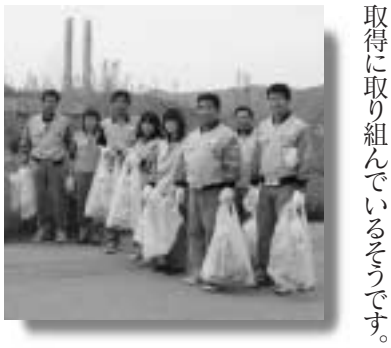
取得に取り組んでいるそうです。

五月十八日、快晴の中、鎌田大隅工芸の皆さんが、工場周辺の清掃を行いました。 年に一度行っている清掃作業は今年で十六回目になり、現在は会社をあげて環境マネジメントシステムISO14001の