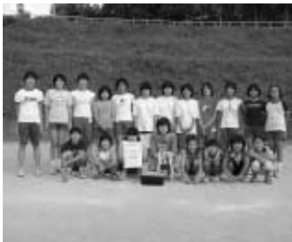
女子の部優勝の第五区子ども会

なお、ソフトボールの優勝チームとドッジボールの優勝、準優勝チームは八月十八日(日)片品村で行われる郡大会に出場いたしました。