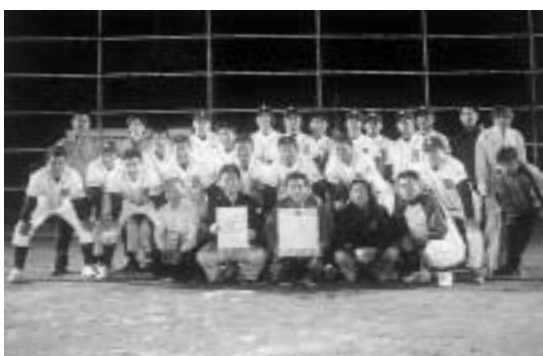
優勝した第五区のみなさん