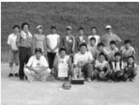
男子の部優勝の第三区子ども会