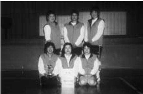
優勝した8支部Cチームの皆さん