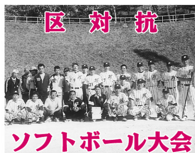
ソフトボール大会

五月十三日(日) 片中中学校校庭において、第二十七回区対抗ソフトボール大会が開催されました。